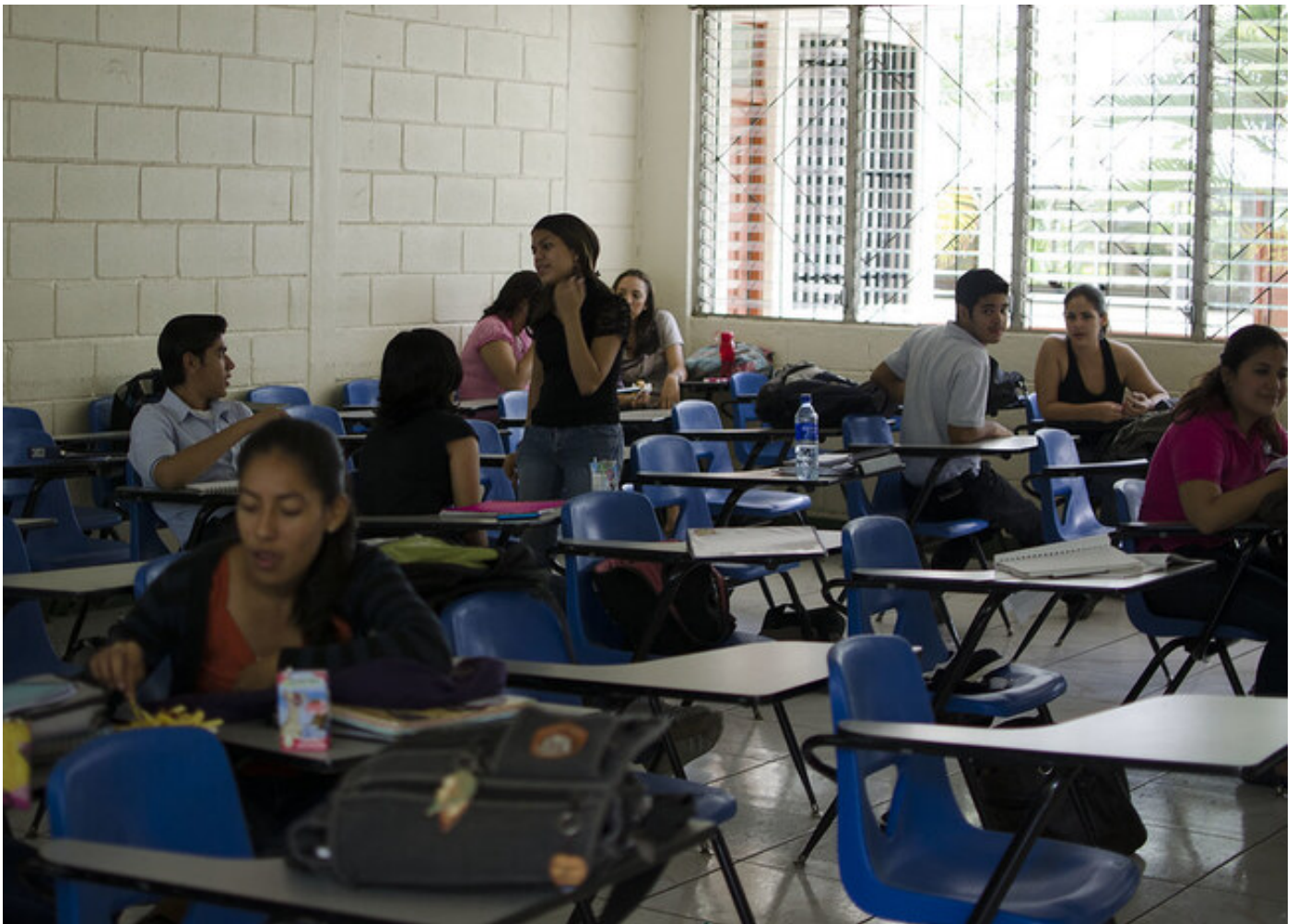
Aula en el campus de la UCA, Managua, Nicaragua.

La Universidad de Costa Rica (UCR), consciente de la importancia de la educación superior y el libre pensamiento en la construcción de sociedades justas y democráticas, denuncia con vehemencia el cierre de la Universidad Centroamericana (UCA) en Nicaragua por parte de la dictadura de Ortega y Murillo. Este lamentable acto refleja el temor del régimen a las voces críticas y al pensamiento independiente y autónomo que ha caracterizado a esta destacada institución a lo largo de su existencia. No es casualidad que con esta acción, la dictadura orteguista haya clausurado ya a más de 30 universidades.