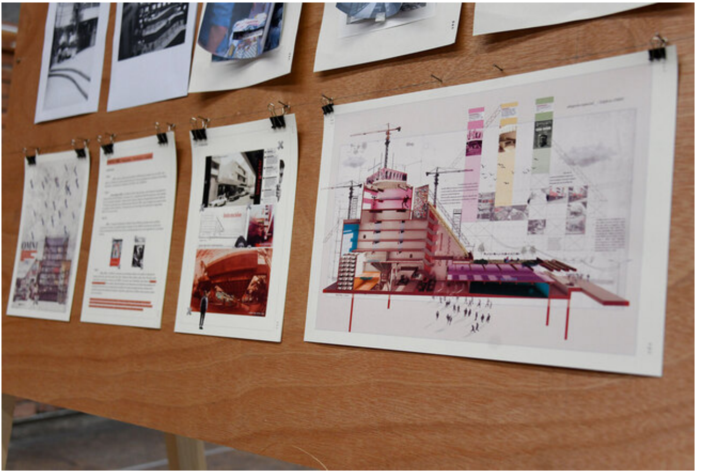
Un ejemplo de los ejercicios que se han realizado en el taller.