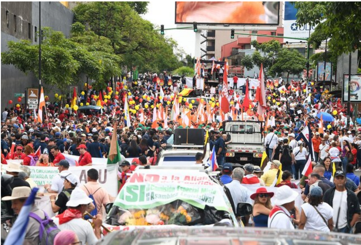
Marcha del 25 de octubre, 2023

La mañana de este 25 de octubre calentó con el testimonio de participantes a la marcha provenientes de los Cen-Cinai, que manifestaron frente a las cámaras del canal Quince-UCR que el personal de las instituciones públicas tiene miedo y es amedrentado .