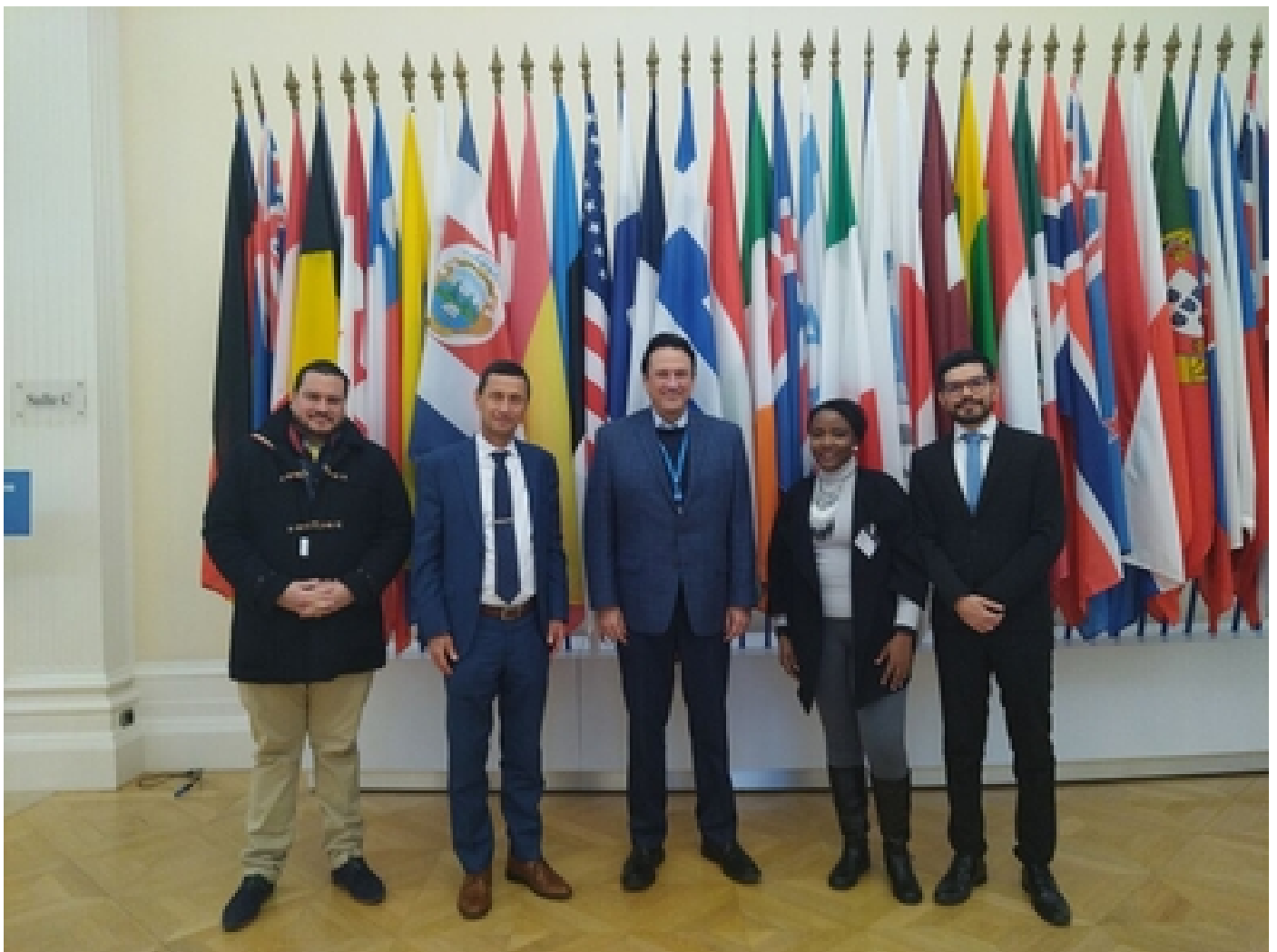
Visita a la OCDE.