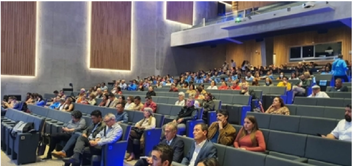
Foro realizado este 28 de noviembre del 2022 en el Aula Magna de la Sede Universitaria Rodrigo Facio.