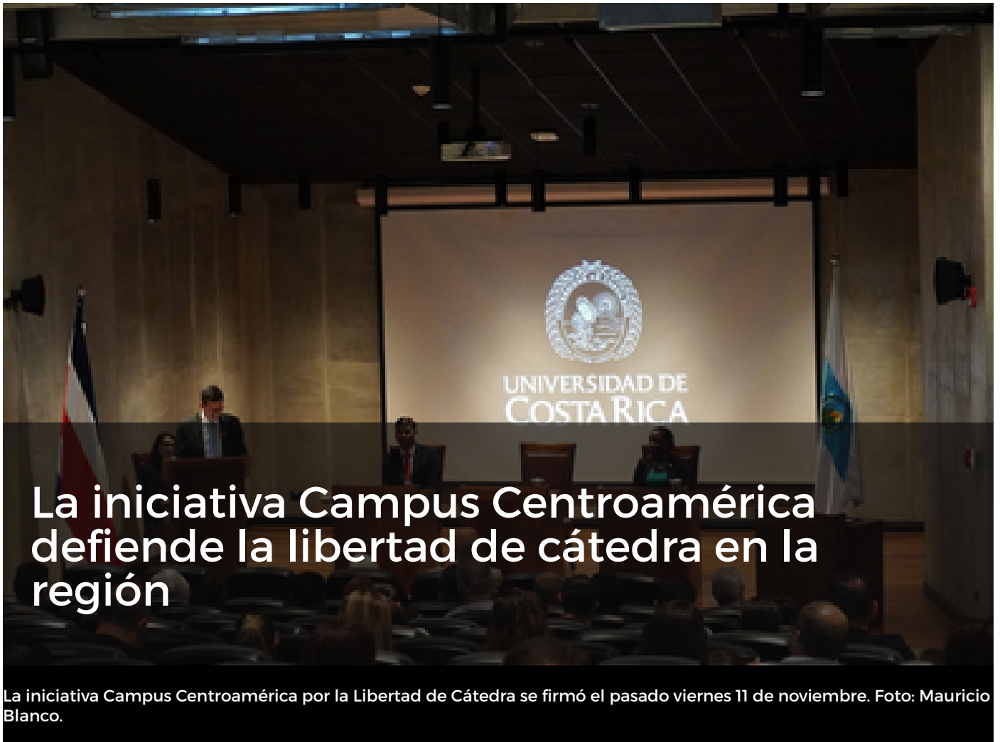
La iniciativa Campus Centroamérica por la Libertad de Cátedra se firmó el pasado viernes 11 de noviembre.

El acuerdo permite la movilidad académica de personas afectadas por la inestabilidad política y condiciones adversas a la academia en otros países centroamericanos