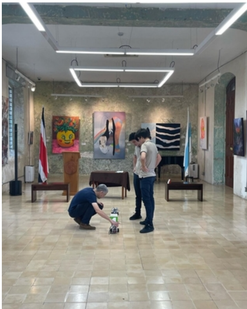
Las actividades del RobotiFestUCR se llevaron a cabo en el Museo Regional de San Ramón.

Gutiérrez señaló además que este evento, desde su conceptualización hasta su puesta en marcha y realización, “procura el crecimiento de las juventudes en temas de alta tecnología, especialmente en la coyuntura de salud que nos ha tocado afrontar; y el combate de la pandemia y la situación económica del país, porque contribuye a cerrar brechas educativas en tiempos que se vislumbran difíciles para la educación pública”.