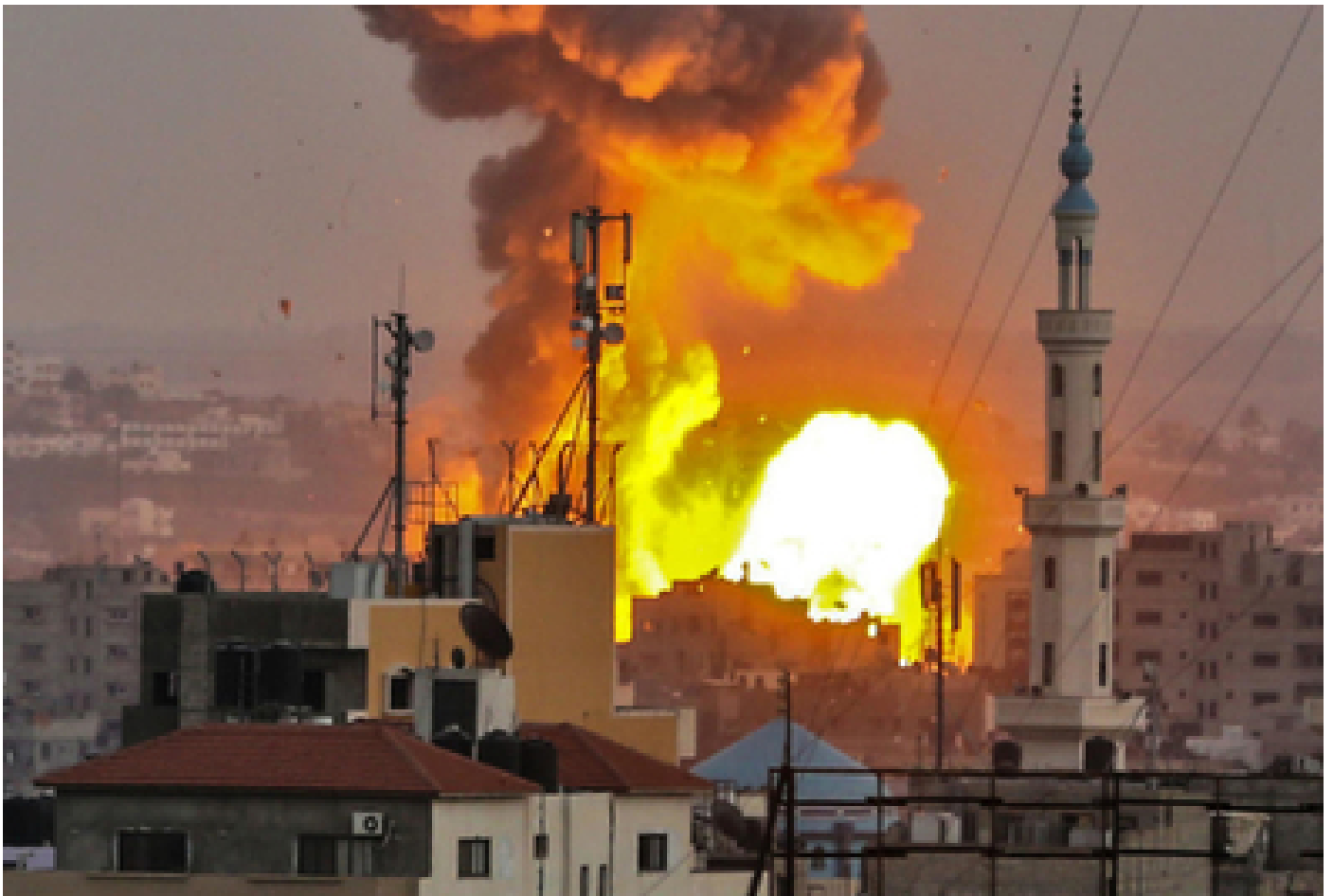
Imagen de bombardeos israelíes en Gaza, extraída de la nota de France24, titulada "Israël bombarde massivement Gaza, l'ONU appelle à éviter la guerre", edición del 20 de julio del 2014.