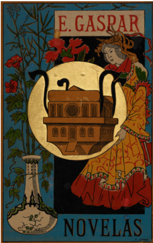
Portada de El anacronópete (1887), ilustración de Gómez Soler.

La máquina de Gaspar, descrita por él como “de forma rectangular”, con “cuatro formidables tubos” y como “una especie de arca de Noé sin quilla” (pp. 64-65), podía viajar hacia el pasado y hacia el futuro. Sin embargo, aunque lo lanzó al mercado en una época en la que la ciencia ficción comenzaba a tener un importante público, Gaspar no tuvo suerte con su libro, el cual no experimentó una difusión tal que lo popularizara.