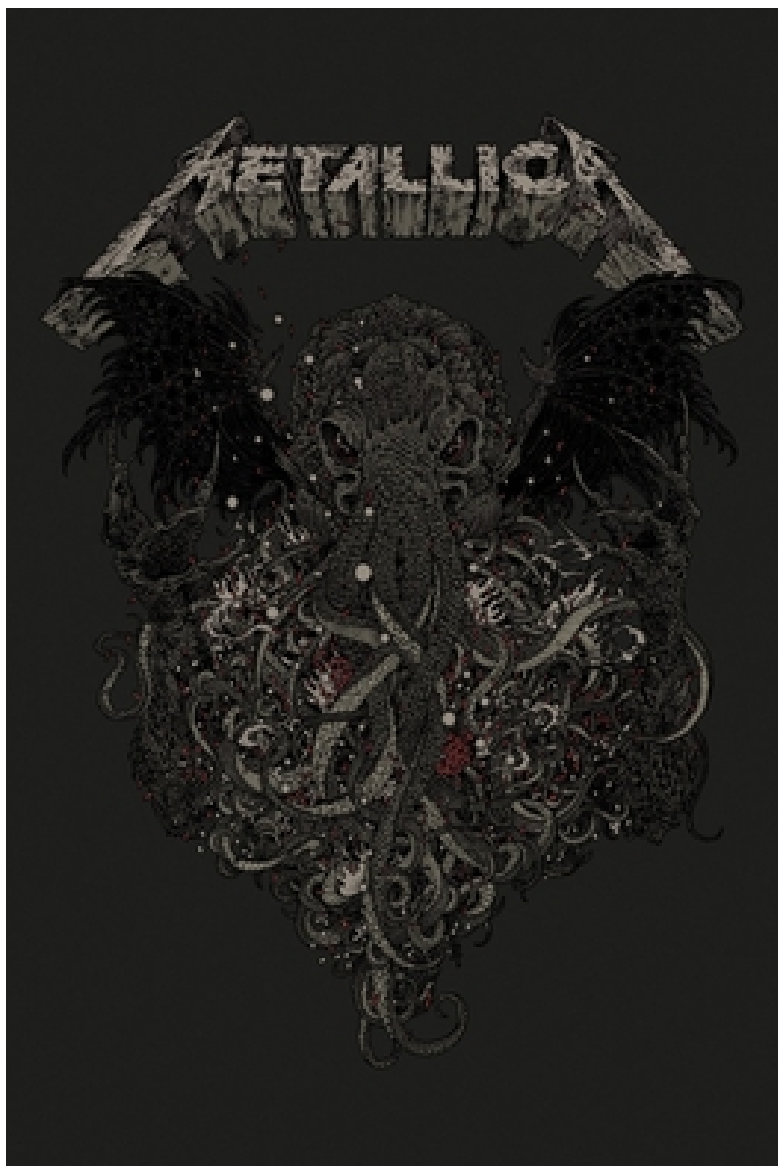
Ilustración del monstruo Cthulhu, hecha por Richey Beckett (2015) para Metallica. Además de las impresiones en papel, este diseño se estampó en camisetas y sudaderas vendidas por la banda.

La primera película basada en los “mitos” es la adaptación cinematográfica de El horror de Dunwich , producida en 1970 por Samuel Arkoff y James Nicholson. La película no fue un gran éxito en sí misma, pero consiguió ampliar la recepción de los “mitos” al sacarlos fuera del ambiente literario y académico. A partir de este momento, el universo de Cthulhu permeó la cultura popular: los abominables tentáculos ya no solo atraparon al cine, sino que también abrazaron la música, como lo muestra la canción de la banda Metallica “The Call of Ktulu”, producida en 1986.