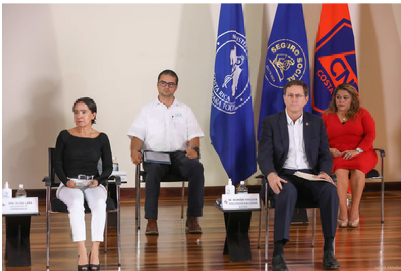
Conferencia de prensa COVID-19 del 17 de mayo del 2020.

Con lo anterior las personas jefes de la Administración Pública Central y de la Administración Pública Descentralizada podrán dar un acompañamiento a los sectores productivos para que la reactivación se realice aplicando todas las medidas posibles con el fin de proteger la salud de los trabajadores, los clientes y la continuidad del negocio.