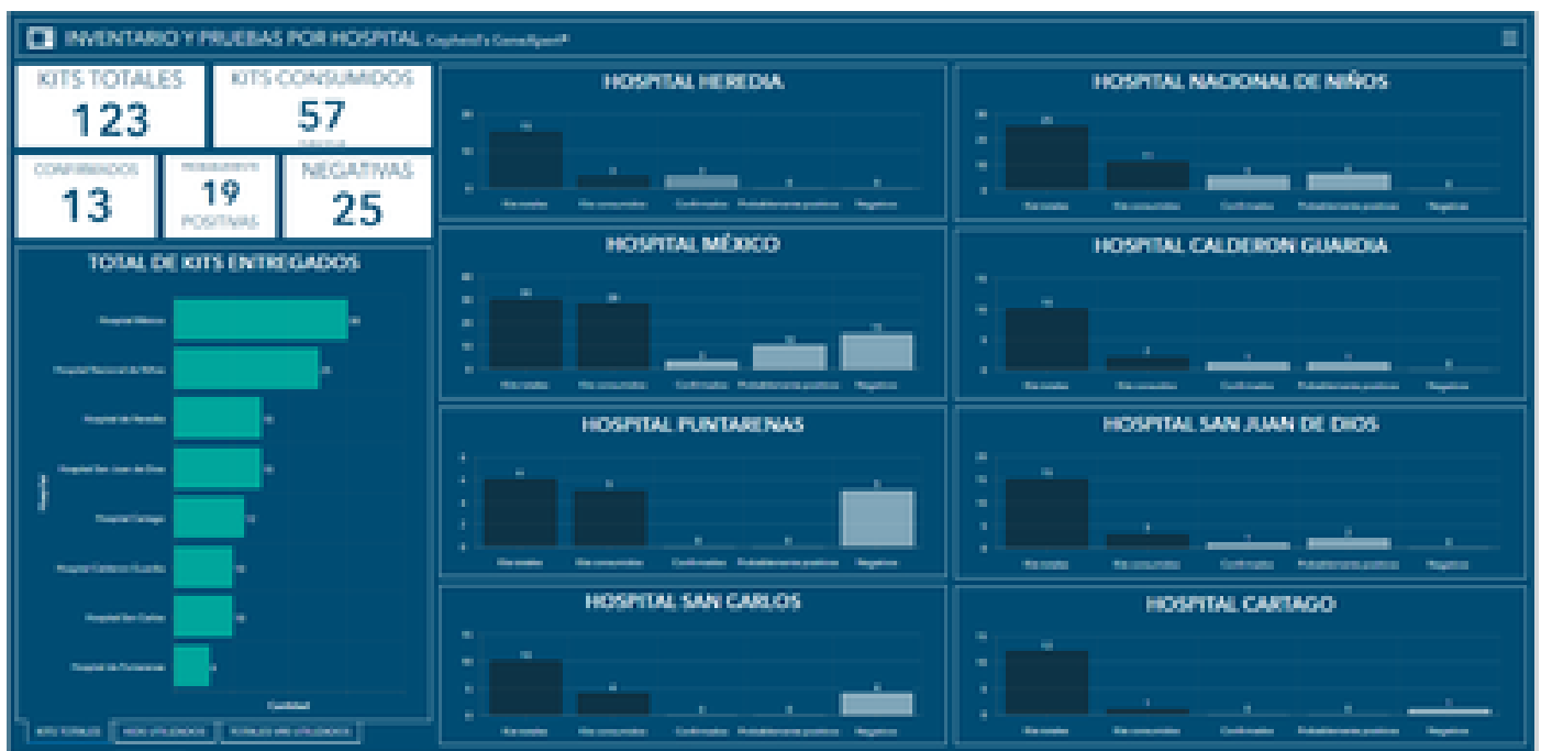
Panel de control principal del sistema de unidades diagnósticas. (Los datos son de simulación y no corresponden con los datos reales a la fecha).

Agregó que toda la información se puede ver un panel de control o dashBoard especializado, el cual es diferente de los convencionales de uso actual que solo muestran los casos infectados, casos recuperados y muertes.