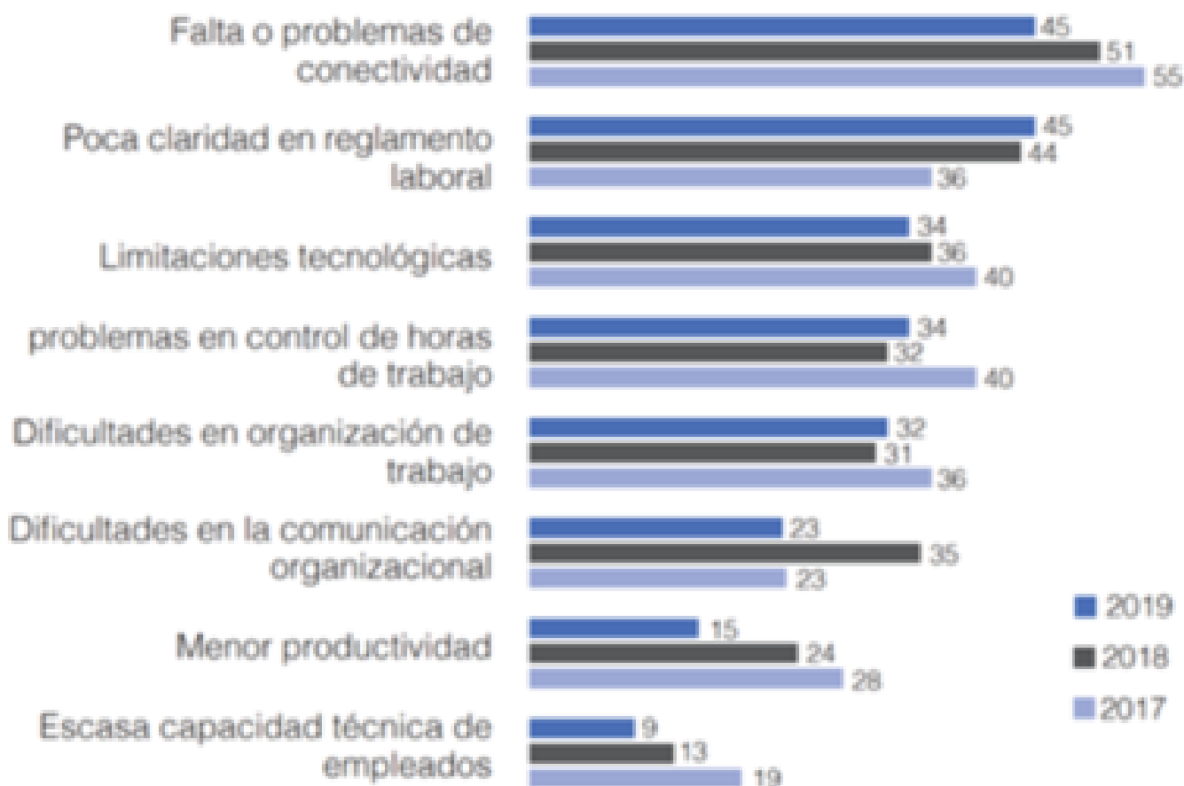
Figura 2 Problemas percibidos en la aplicación del teletrabajo 2017 - 2019

En contraste, la poca claridad en el reglamento laboral muestra una tendencia opuesta, aumentando en el tiempo. Parece que conforme el problema técnico se resuelve, las complejidades legales del teletrabajo se convierten gradualmente en la mayor preocupación del empleador.