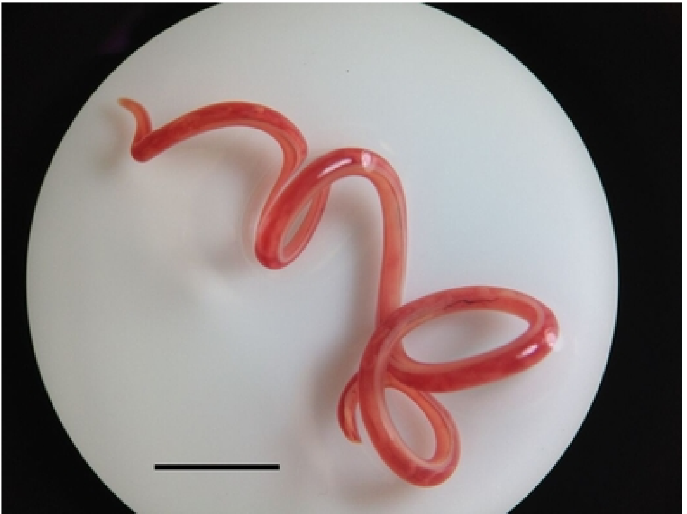
En esta fotografía se puede observar en primer plano a la Spirocerca lupi .