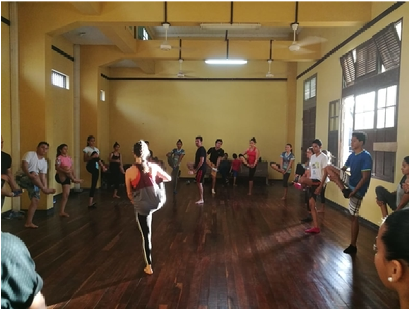
Taller de Danza U en Guanacaste 2018.

Entre espectáculos, talleres y otras labores, el año pasado 10000 personas tuvieron la oportunidad de acercarse y conocer más sobre el quehacer de Danza Universitaria.