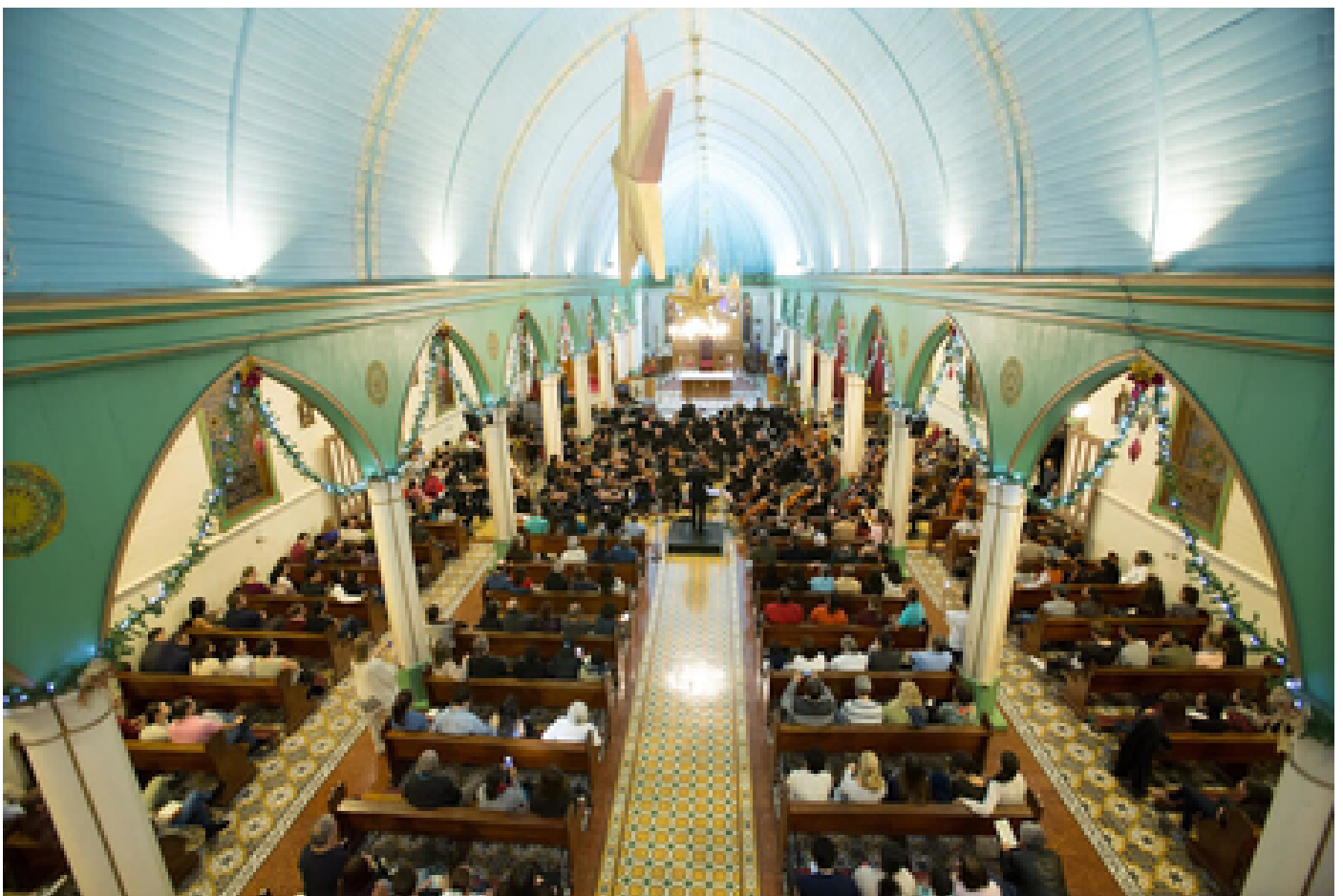
Presentación de la Orquesta Sinfónica de la UCR en la iglesia de San Antonio de Escazú.

Para la EAM, la temporada es una forma de compartir con el público nacional e internacional la calidad musical costarricense . Además, busca democratizar el acceso a eventos artísticos de alto nivel a través de la tecnología, ya que muchos de los conciertos son transmitidos en vivo y están disponibles por medio del canal de YouTube Artes Musicales UCR .