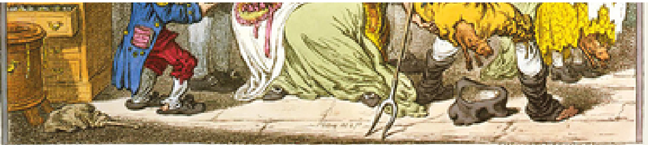
The Cow-Pox ... or ... the Wonderful Effects of the New Inoculation! ... with the multiplication of the Small-Pox ...