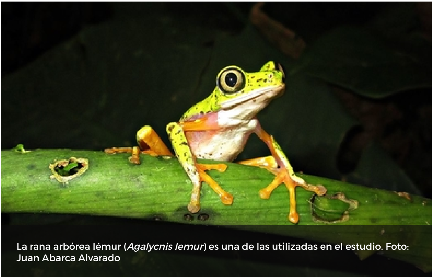
La rana arbórea lémur ( Agalychnis lemur ) es una de las utilizadas en el estudio.

En febrero pasado la revista Nature Ecology & Evolution publicó un artículo sobre la correlación entre la diversidad del microbioma de los anfibios y el entorno en el que estos se desarrollan. Para su elaboración participaron más de 30 científicos provenientes de