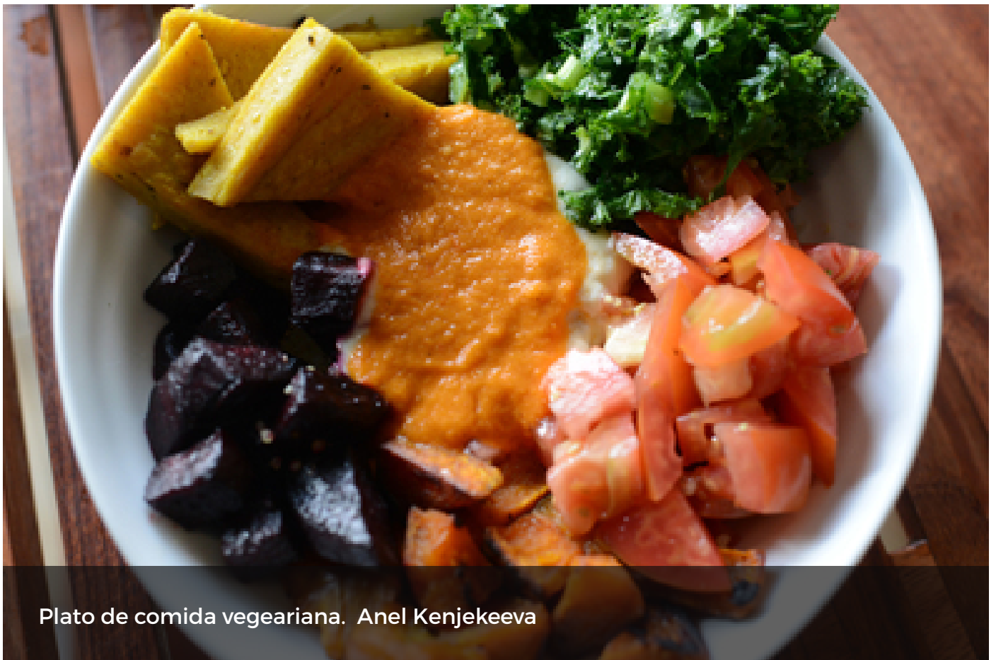
Plato de comida vegeariana. Anel Kenjekeeva

Estamos, prácticamente, en la época navideña. Con ella, los encuentros sociales se incrementan y casi todos están marcados por los platillos típicos de la época.