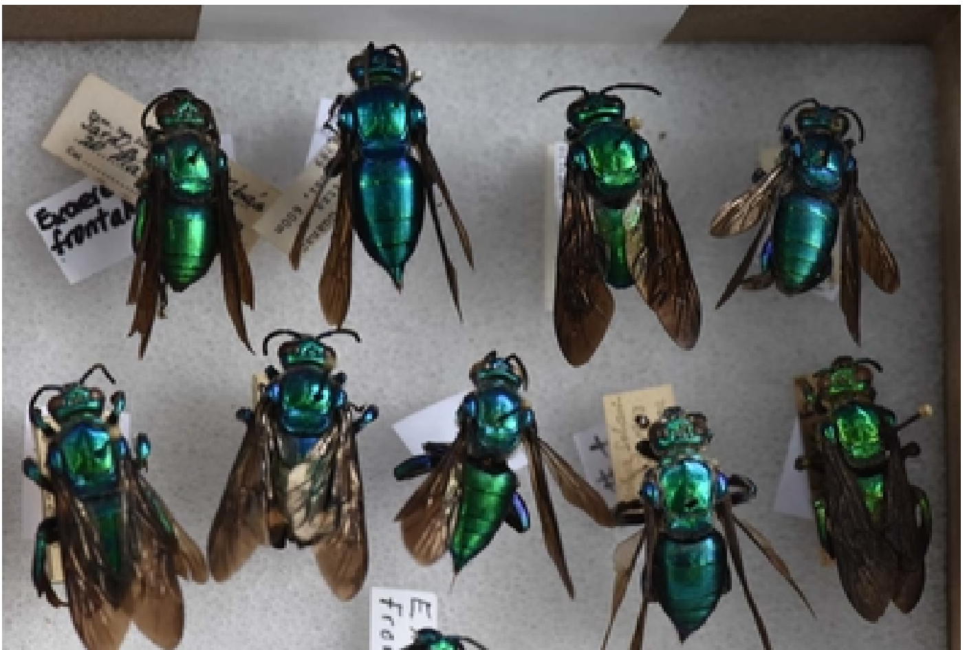
Las avispas son utilizadas en algunos casos para controlar plagas en cultivos. Karla Richmond

—¿Cómo ha cambiado el estudio de los insectos desde cuando usted comenzó a estudiarlos hasta hoy en día?