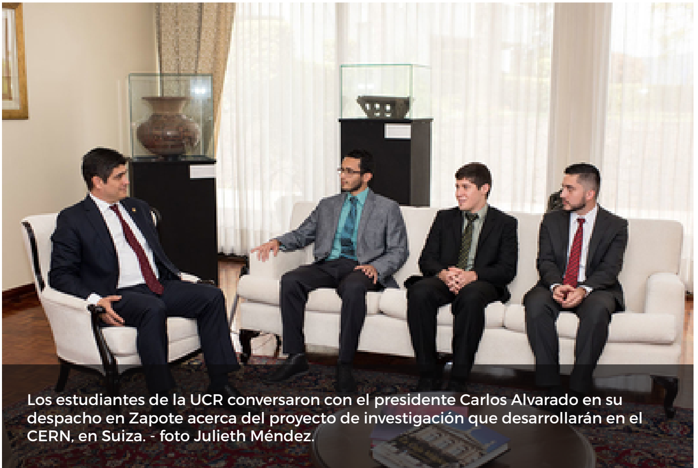
Los estudiantes de la UCR conversaron con el presidente Carlos Alvarado en su despacho en Zapote acerca del proyecto de investigación que desarrollarán en el CERN, en Suiza.

En busca de oportunidades para realizar investigación, los tres estudiantes se postularon al programa del CERN y, después de superar los requisitos y algunas etapas de entrevistas, fueron seleccionados entre más de 3000 postulantes a nivel mundial.