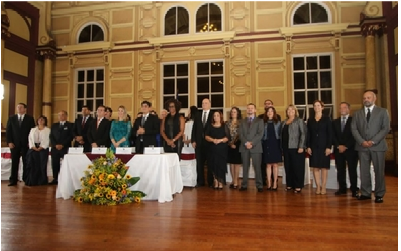
Fotografía del Gabinete de Gobierno presentado por el presidente electo de la República, Carlos Alvarado Quesada.