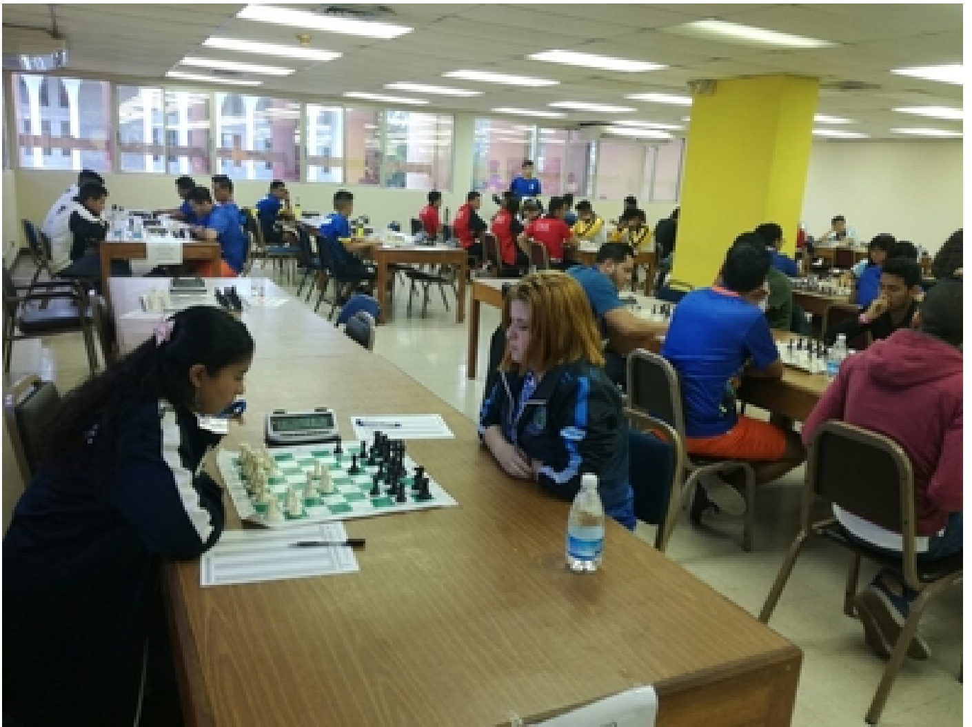
Los próximos JUDUCA se realizarán en el 2020, en Guatemala.