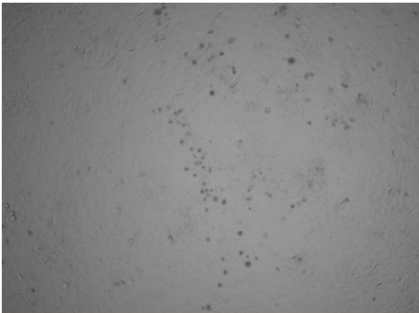
Imagen de fondo claro de las células bajo estudios de quimiosensibilidad. La difícil identificación de las células genera grandes retos para los informáticos y los ingenieros.