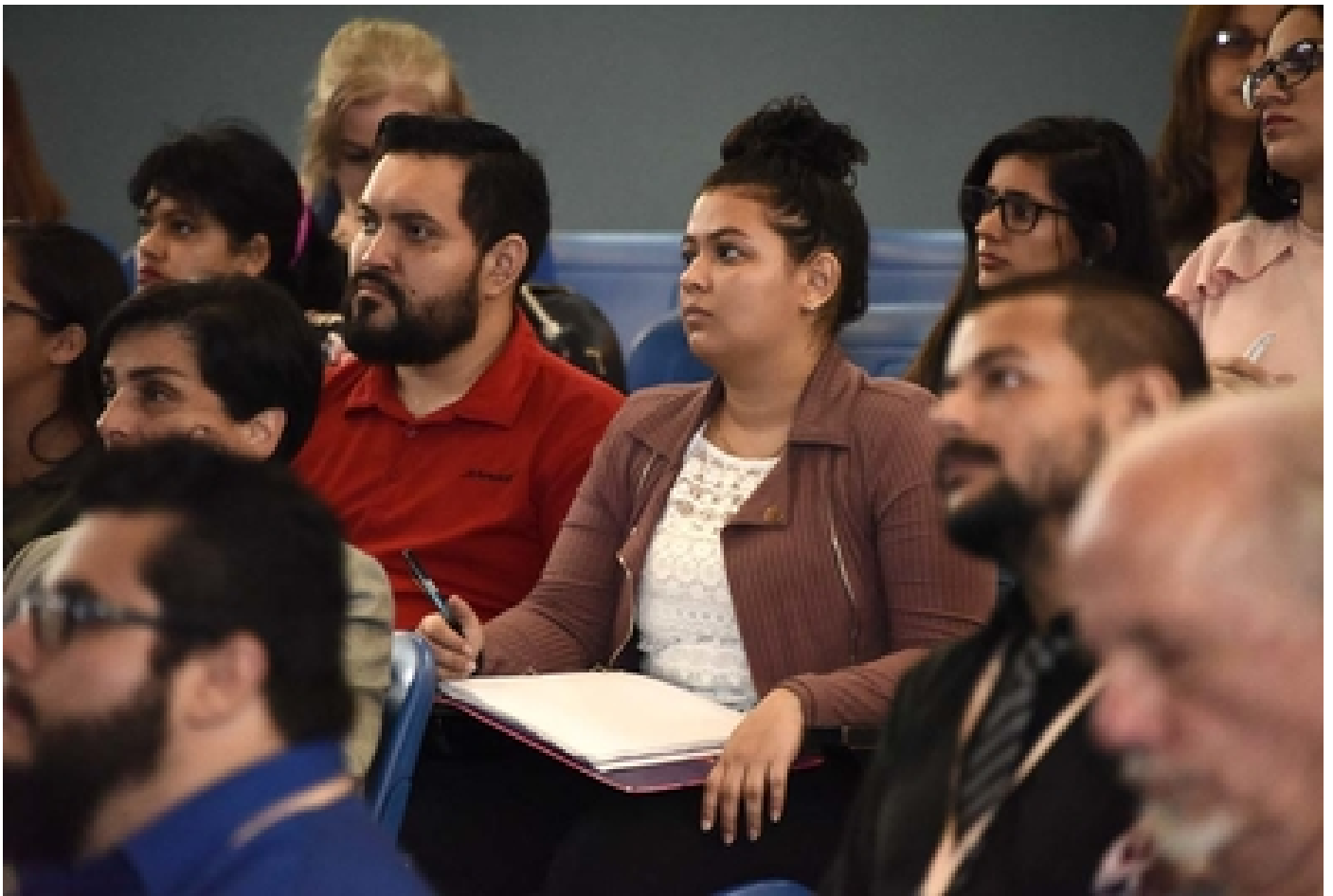
El foro de salud mental se llevó a cabo el miércoles 3 de octubre con la participación de empleados del sector salud, investigadores, personas sobrevivientes del suicidio y organizaciones no gubernamentales.