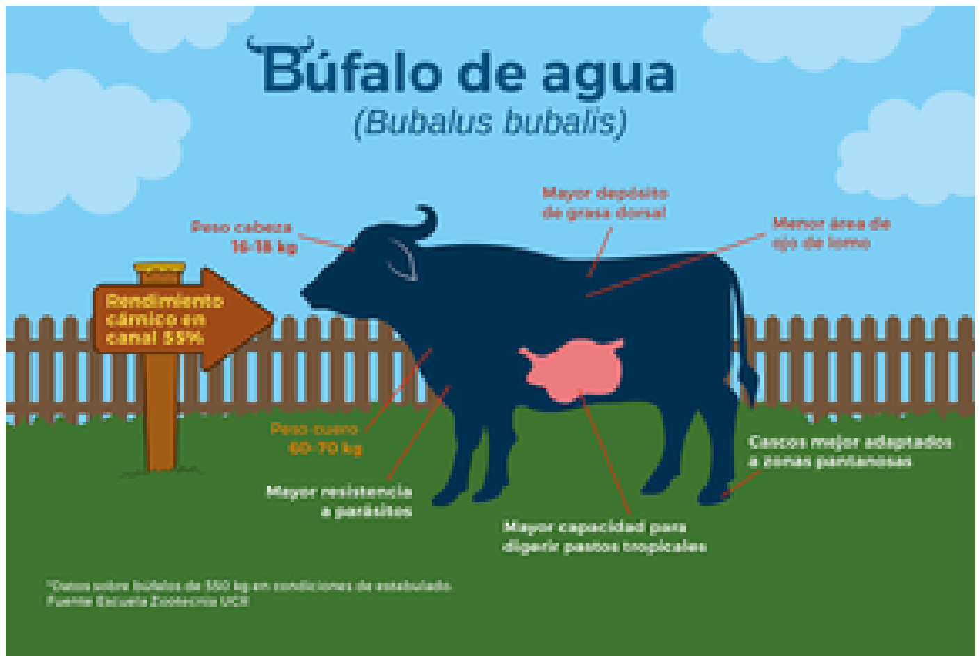
Ilustración: Rafael Espinoza.

En la medición de área de ojo de lomo , que se realiza con ultrasonido para predecir el rendimiento en la canal, el búfalo presentó resultados de un 10% menos con respecto a los bovinos a los 550 kg de peso promedio.