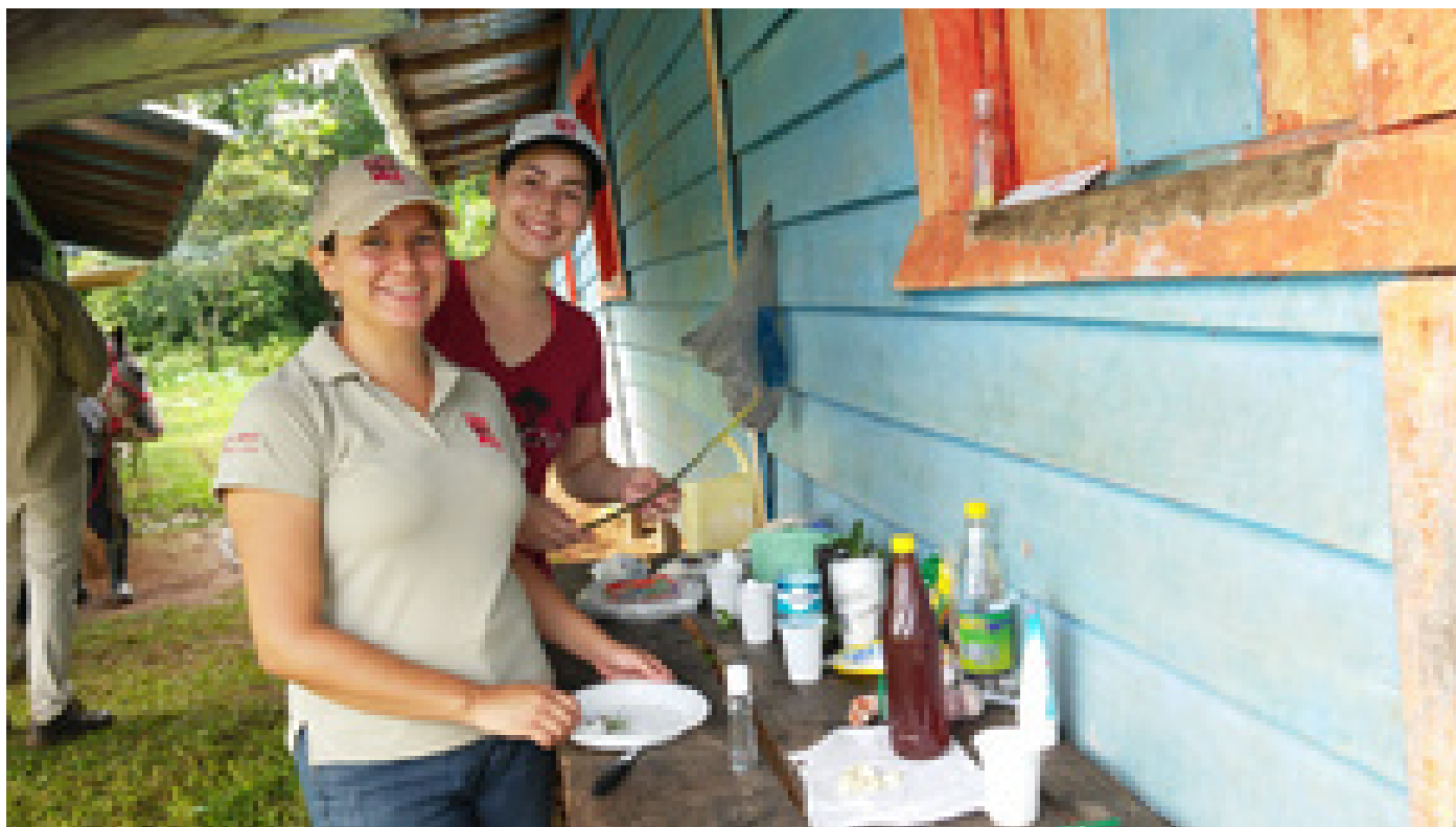
Estudiantes del TC-634 preparan recetas a base de miel de abeja y otros ingredientes naturales para la curación de los caballos.

Desde el proyecto universitario se pretende contribuir con organizaciones de productores comunales y rurales de la región Brunca en la gestión sostenible de sus proyectos mediante la asesoría y la capacitación. Su aporte en la mejora directa en el bienestar de estos animales también impacta sobre la calidad de vida de la comunidad, ya que las personas están en contacto directo con ellos. No brindarles los cuidados adecuados podría convertirlos en vectores de enfermedades o provocar que mueran.