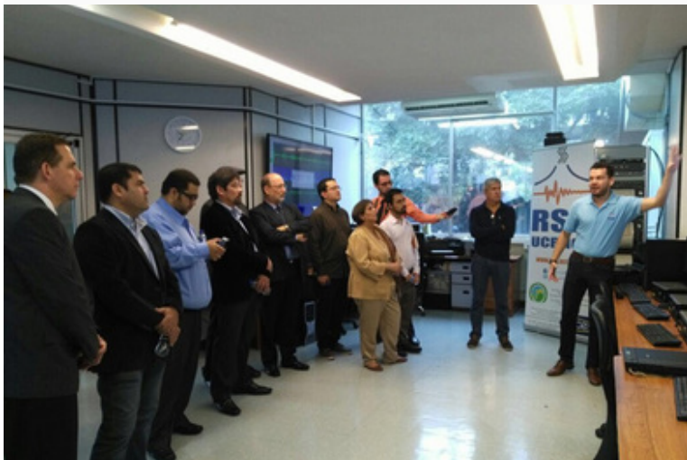
Marco Vinicio Redondo, diputado del Partido Acción Ciudadana