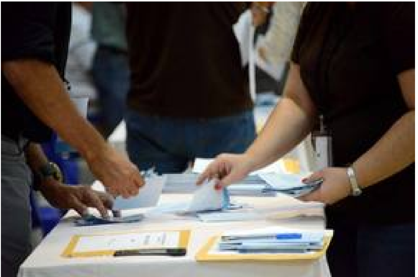
El conteo de los votos se prolongó aproximadamente durante dos horas.