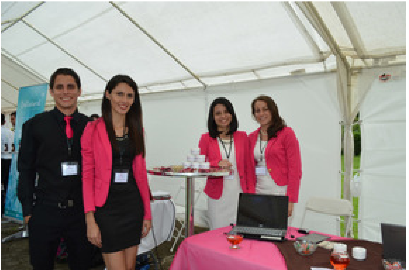
Grupo creador de la crema aclaradora Clarice.

FreshDent es otro de los productos que se presentará en Expoinnova, es un enjuague bucal a base de hojas de guayaba y esencia de menta, como tratamiento contra afecciones bucales.