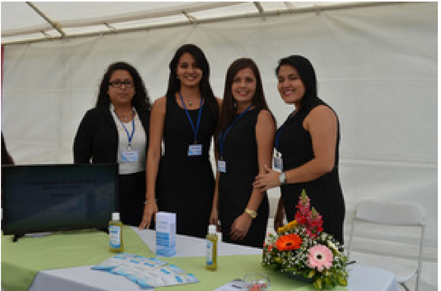
Grupo creador del enjuague bucal FreshDent.