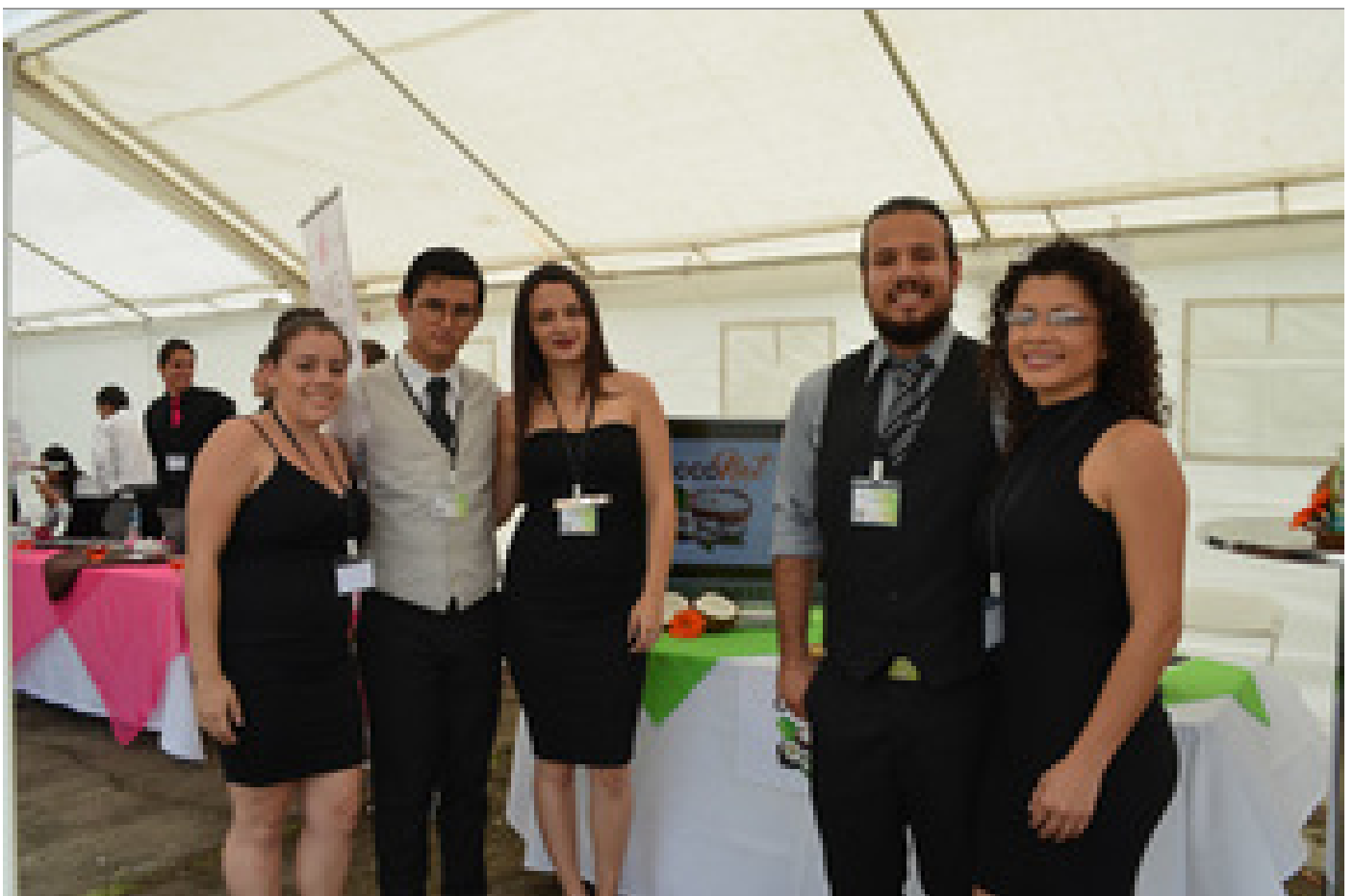
Grupo creador de la natilla sin lactosa CocoNat.