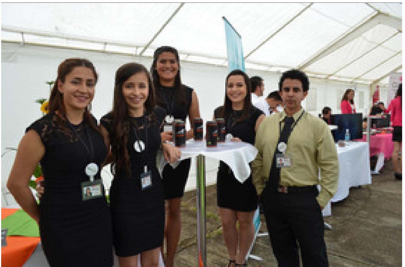
Grupo creador de Lion Energy, una bebida energética.