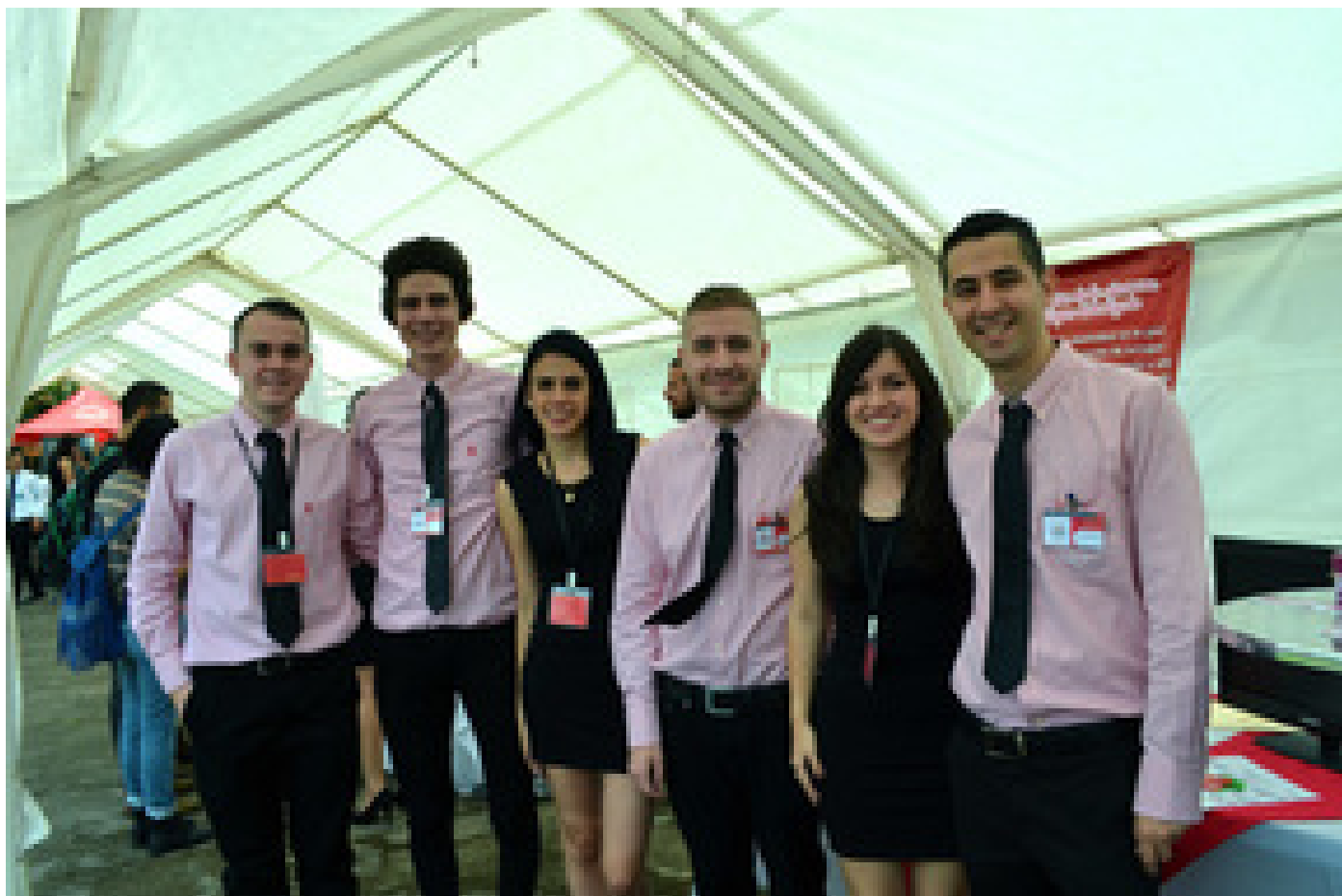
Grupo creador del helado SuFrost.

Según la profesora Vivian Murillo, quien imparte el curso en la Sede de Occidente, en esta oportunidad se presentarán en ExpoInnova “seis proyectos muy innovadores todos desde el área de salud y el área de alimentos, los muchachos hicieron un esfuerzo muy grande y presentarán proyectos novedosos con bases económicas muy bien calculadas”.