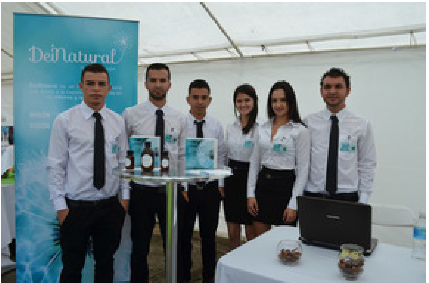
Grupo creador del medicamento para expulsar las piedras en los riñones y la vesícula DeiNatural