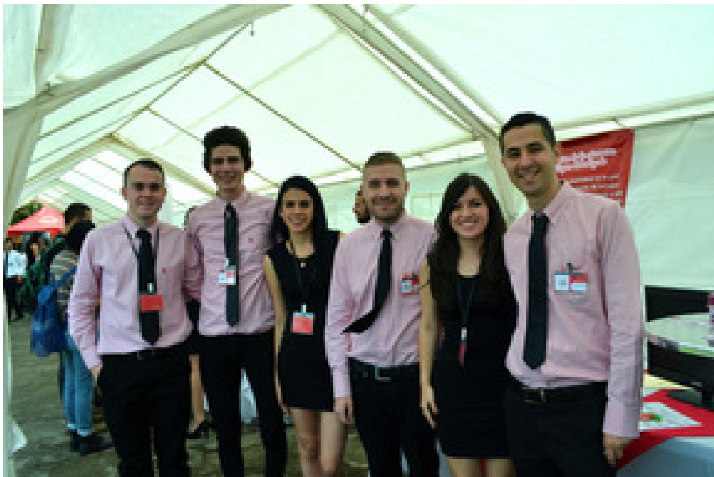
Grupo creador del helado SuFrost.