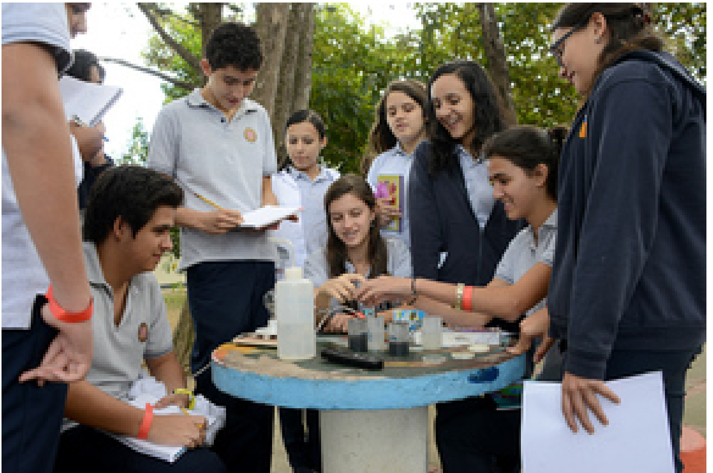
Con un medidor portátil pH y conductividad eléctrica (C.E.) se midió la conductividad eléctrica en agua del tubo, una solución nutritiva y dos tipos de suelo.