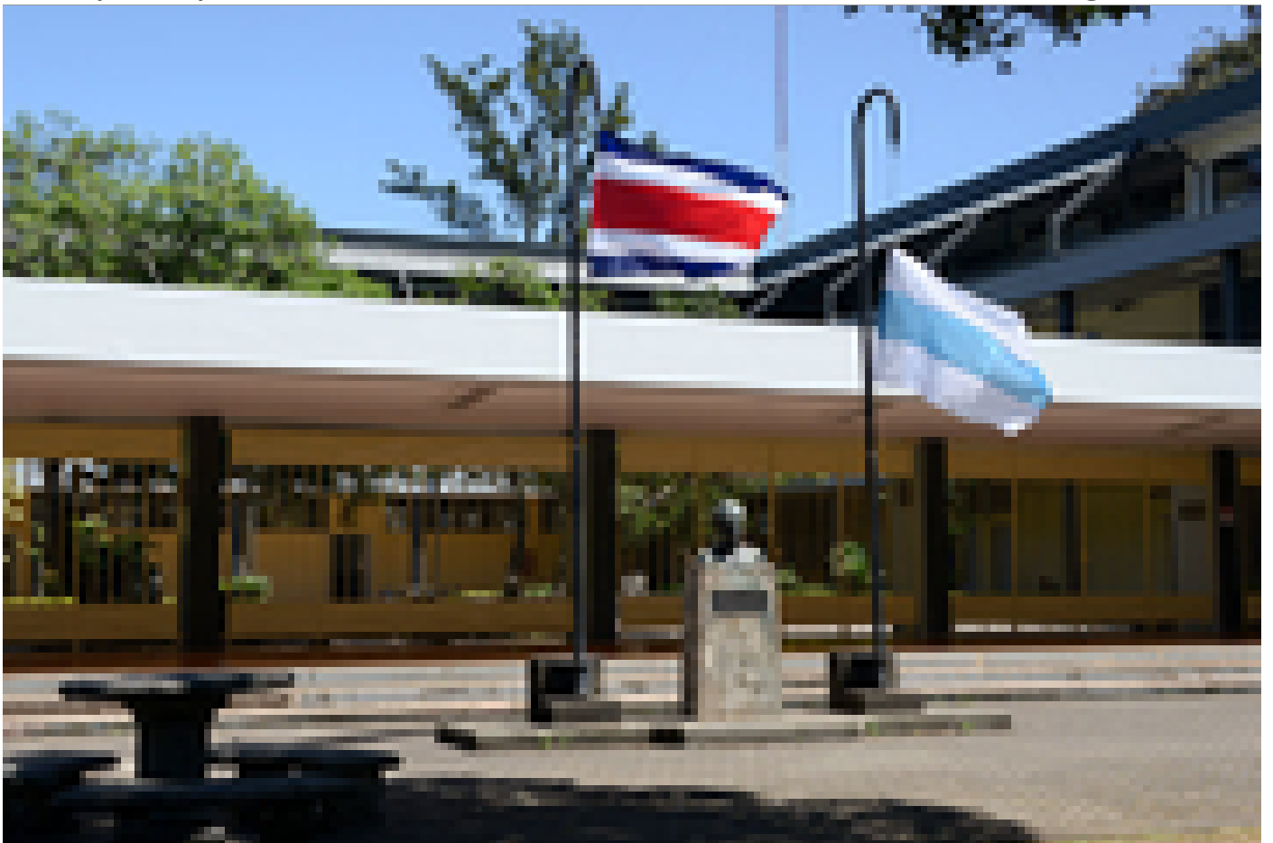
La bandera de la UCR permanecerá a media asta durante tres días como parte del duelo institucional.