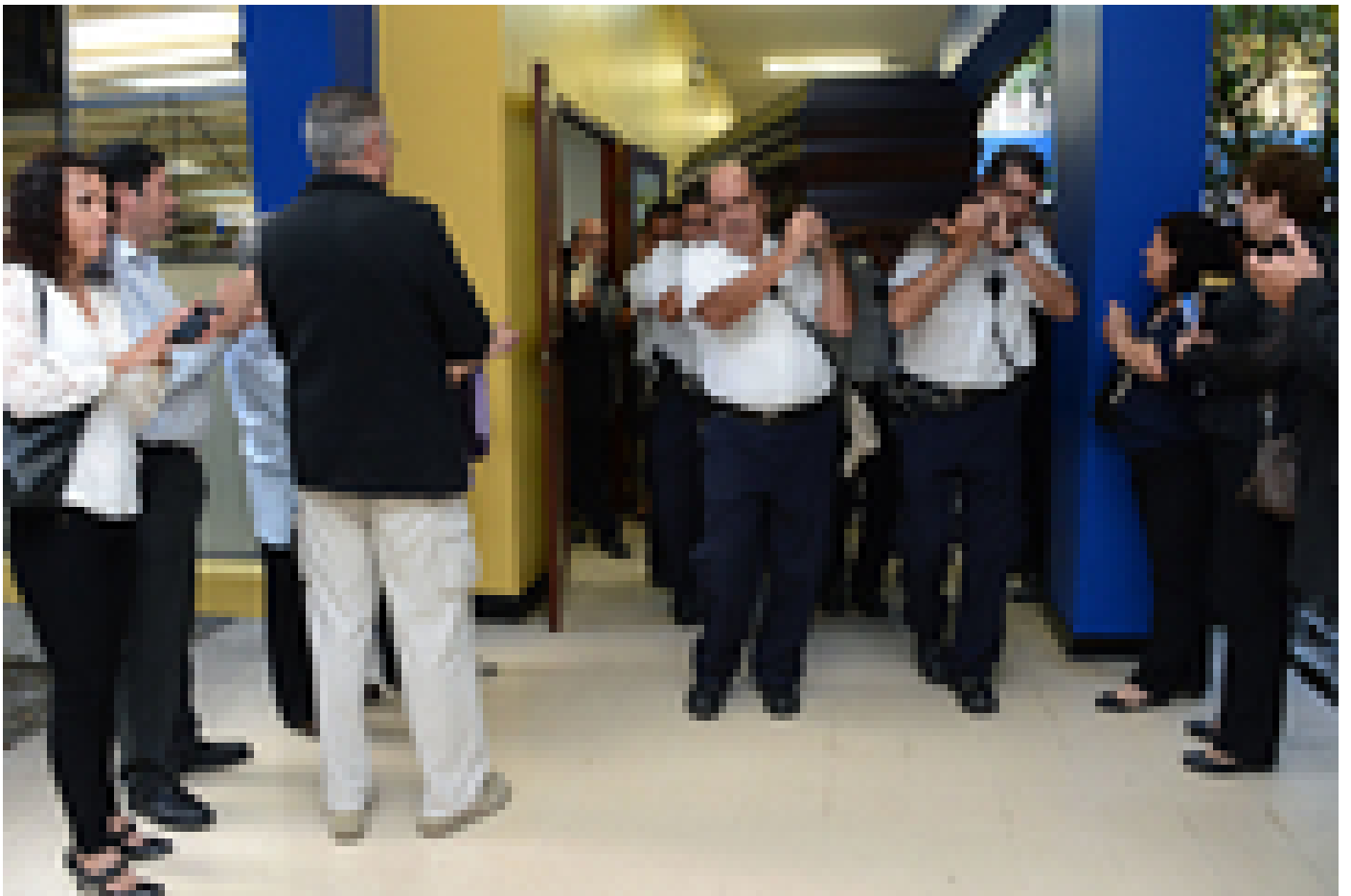
Funcionarios de la Sección de Seguridad y Tránsito de la UCR cargaron el feretro del ex rector por los pasillos de la Facultad de Ciencias Económicas.