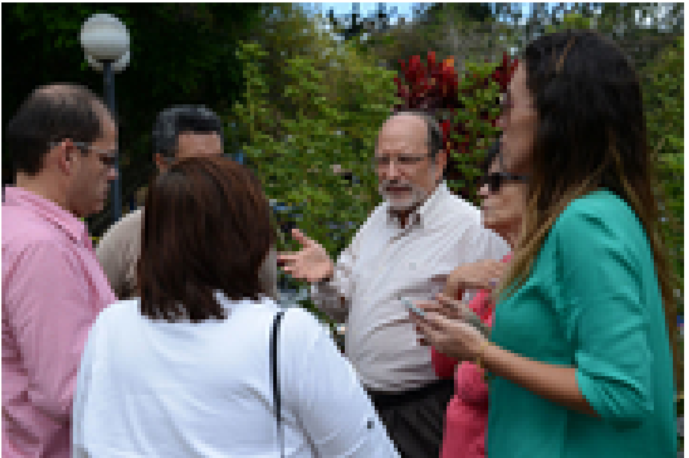
Autoridades de la Institución inspeccionaron los sitios donde cayeron los árboles.