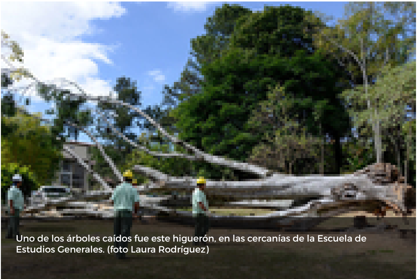
Uno de los árboles caídos fue este higuerón, en las cercanías de la Escuela de Estudios Generales.

Ráfagas de viento que presentaron una velocidad máxima de 55 kilómetros por hora golpearon esta tarde, entre las 12:45 y la 1:15 p.m., el cantón de Montes de Oca provocando la caída de cuatro árboles en diferentes fincas de la Universidad de Costa Rica (UCR).