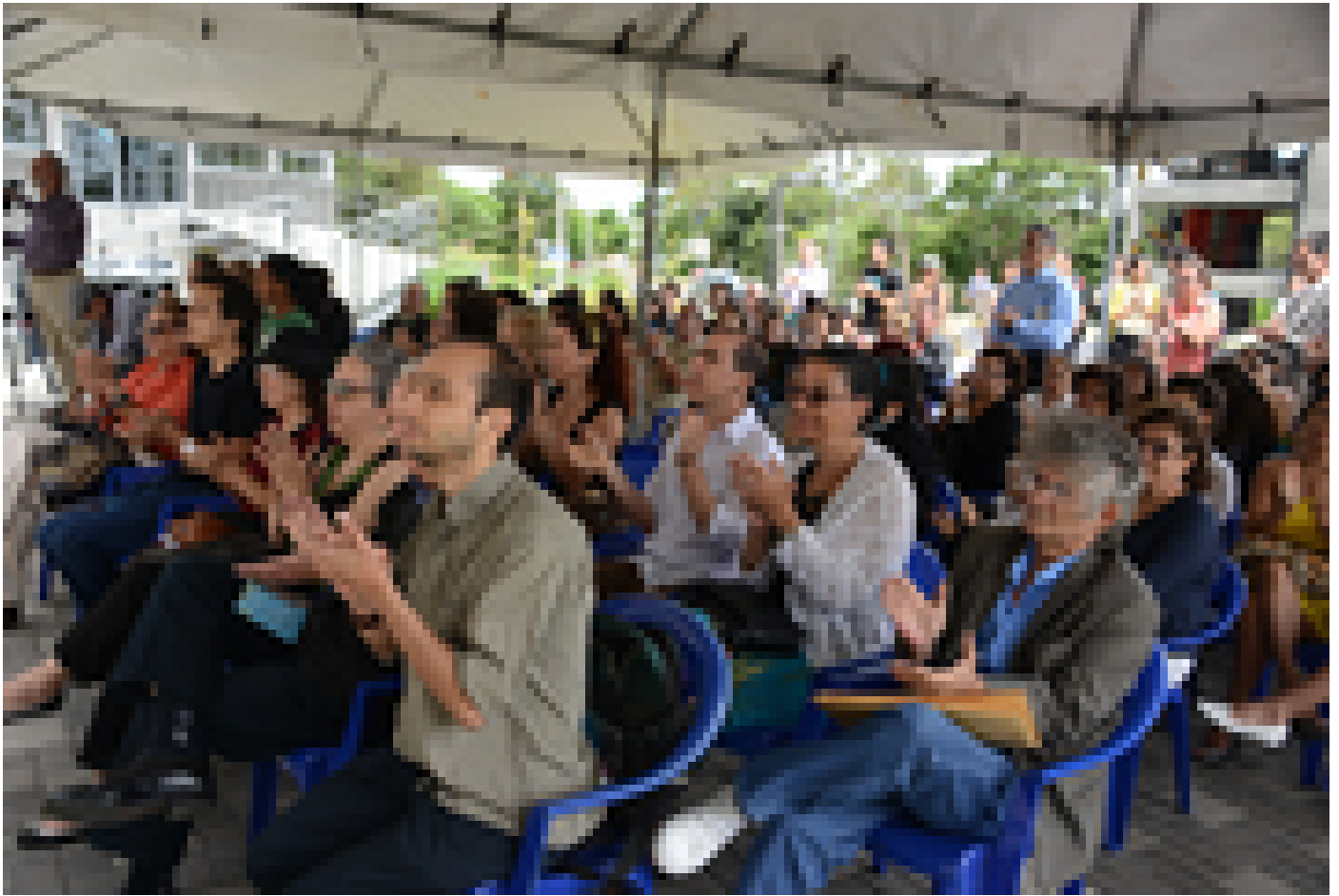
Autoridades universitarias, estudiantes, familiares y amigos del artista aplaudieron durante la develación de la obra "Yo protesto".