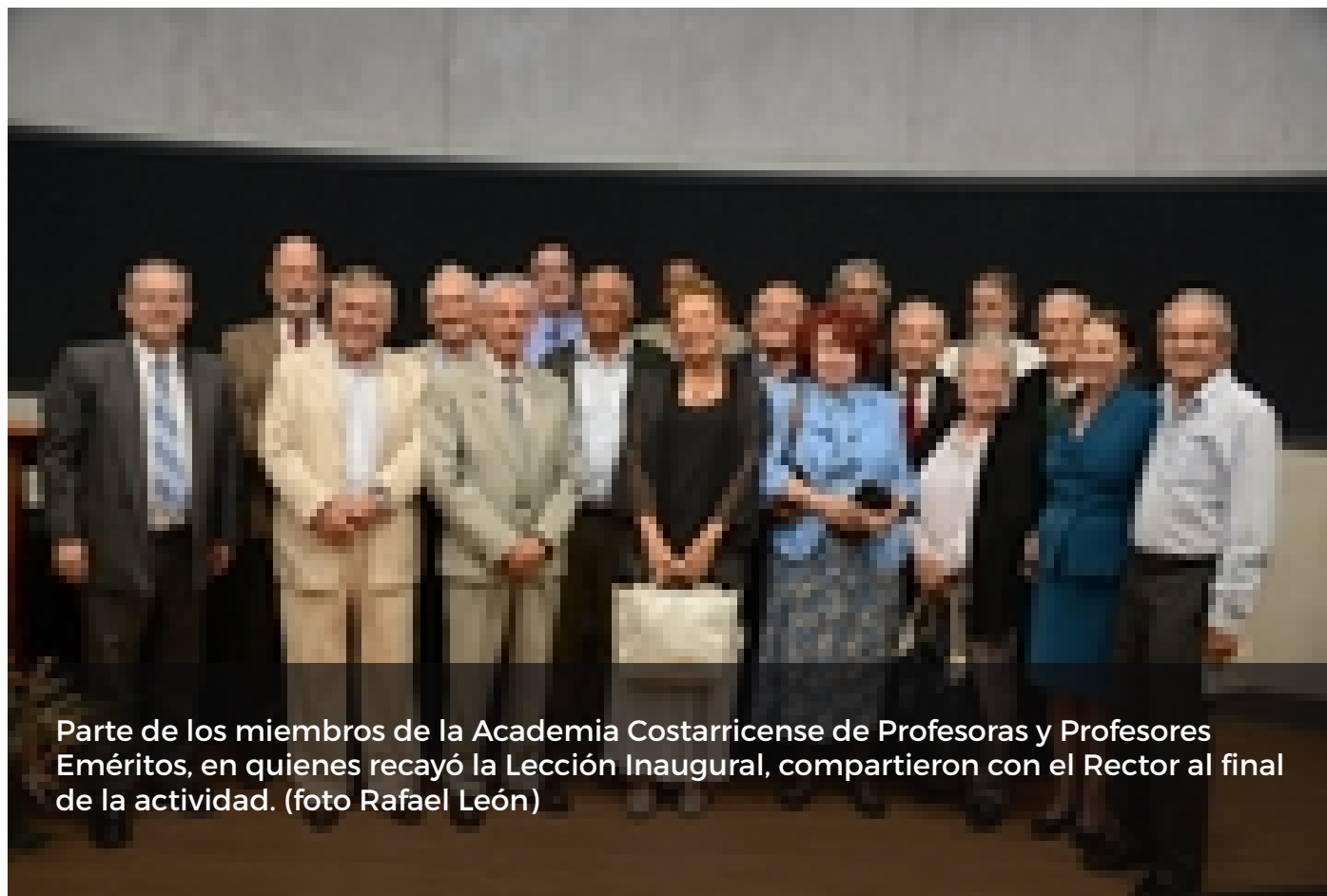
Parte de los miembros de la Academia Costarricense de Profesoras y Profesores Eméritos, en quienes recayó la Lección Inaugural, compartieron con el Rector al final de la actividad.