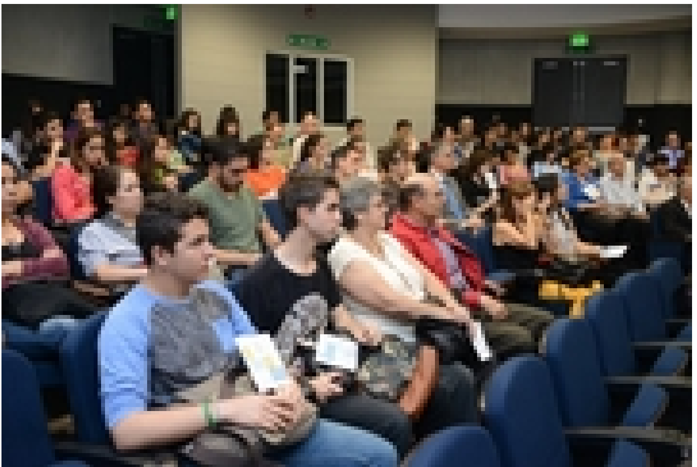
El conferencista se dirigió especialmente a un grupo de estudiantes de la Escuela de Estudios Generales que siguió la Lección Inaugural.