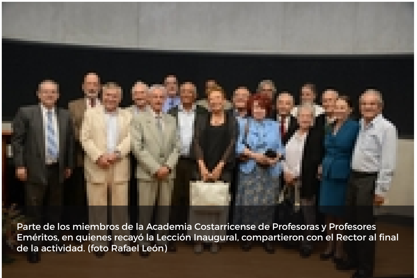
Parte de los miembros de la Academia Costarricense de Profesoras y Profesores Eméritos, en quienes recayó la Lección Inaugural, compartieron con el Rector al final de la actividad.