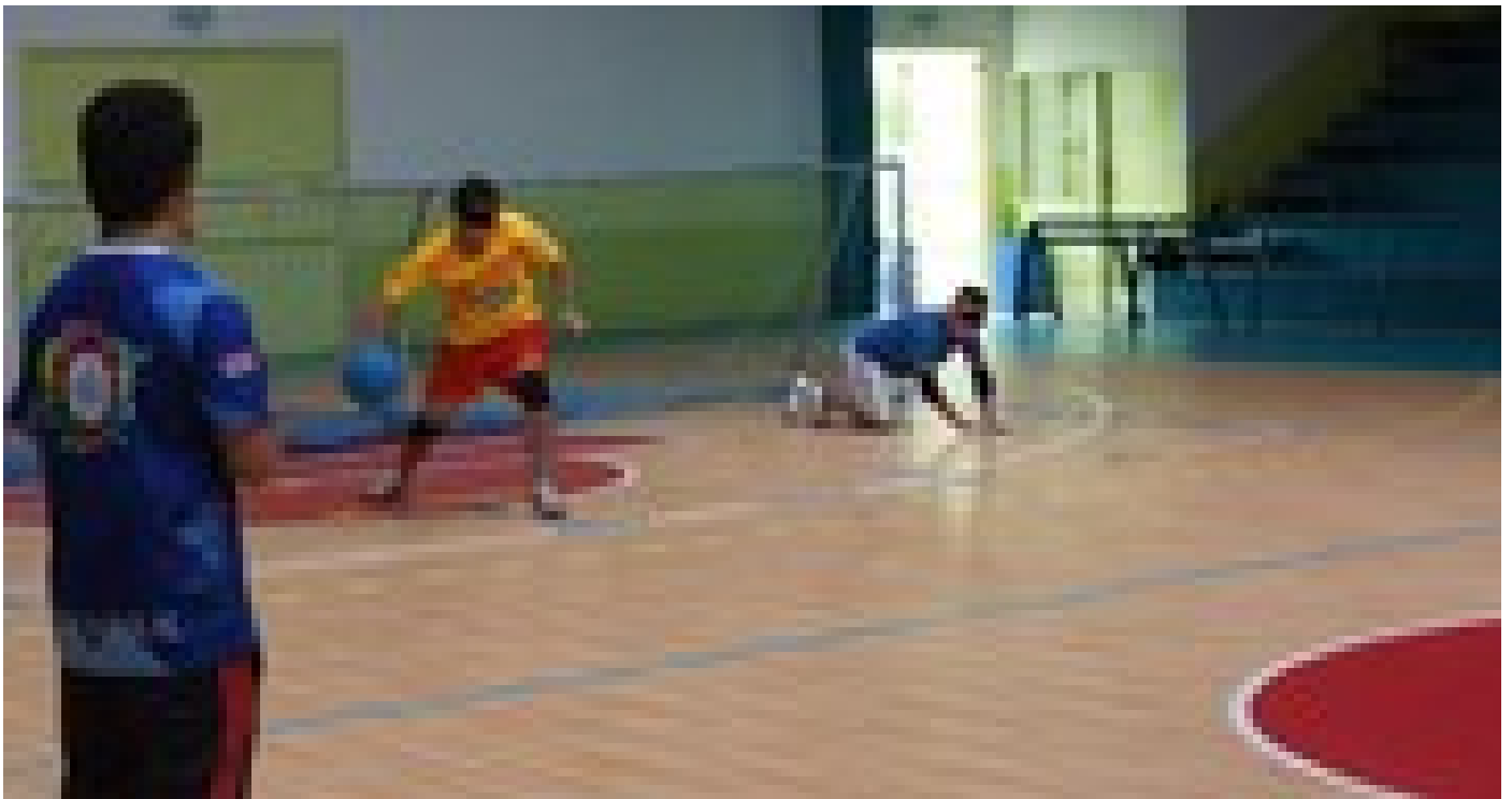
En el gimnasio fue la práctica del llamado bolagol del campamento.