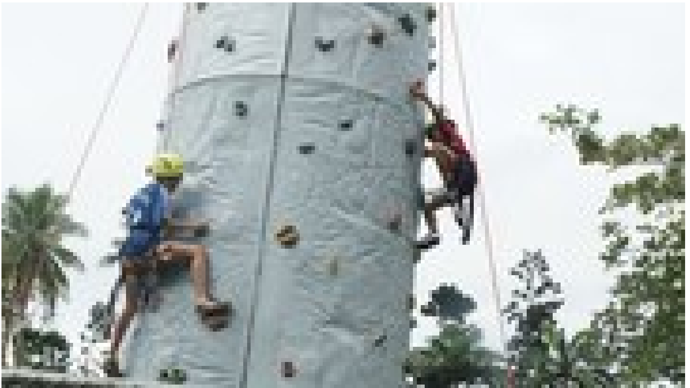
Una nueva atracción para los campistas fue la pared de rocas que escalaron

Según lo informó la coordinadora, lo novedoso de este año fueron el viaje en canoa hawaiana, la práctica del judo, el escalar la pared de rocas y el canopy , pero además se incluyen todos los otros deportes permanentes del campamento, como son la gimnasia, el atletismo, el rally de orientación deportiva, entre otros. En esta edición no pudieron realizar actividades en el río, por exceso de lluvias, pero en otras ocasiones han hecho Kayak y viaje por el embalse de San Buenaventura, de Turrialba , informó la coordinadora, al explicar que pese al mal clima que imperó en la zona en los días previos al campamento, se pudieron realizar todas las actividades programadas y solo faltaron cuatro personas de las 30 que estaban inscritas.