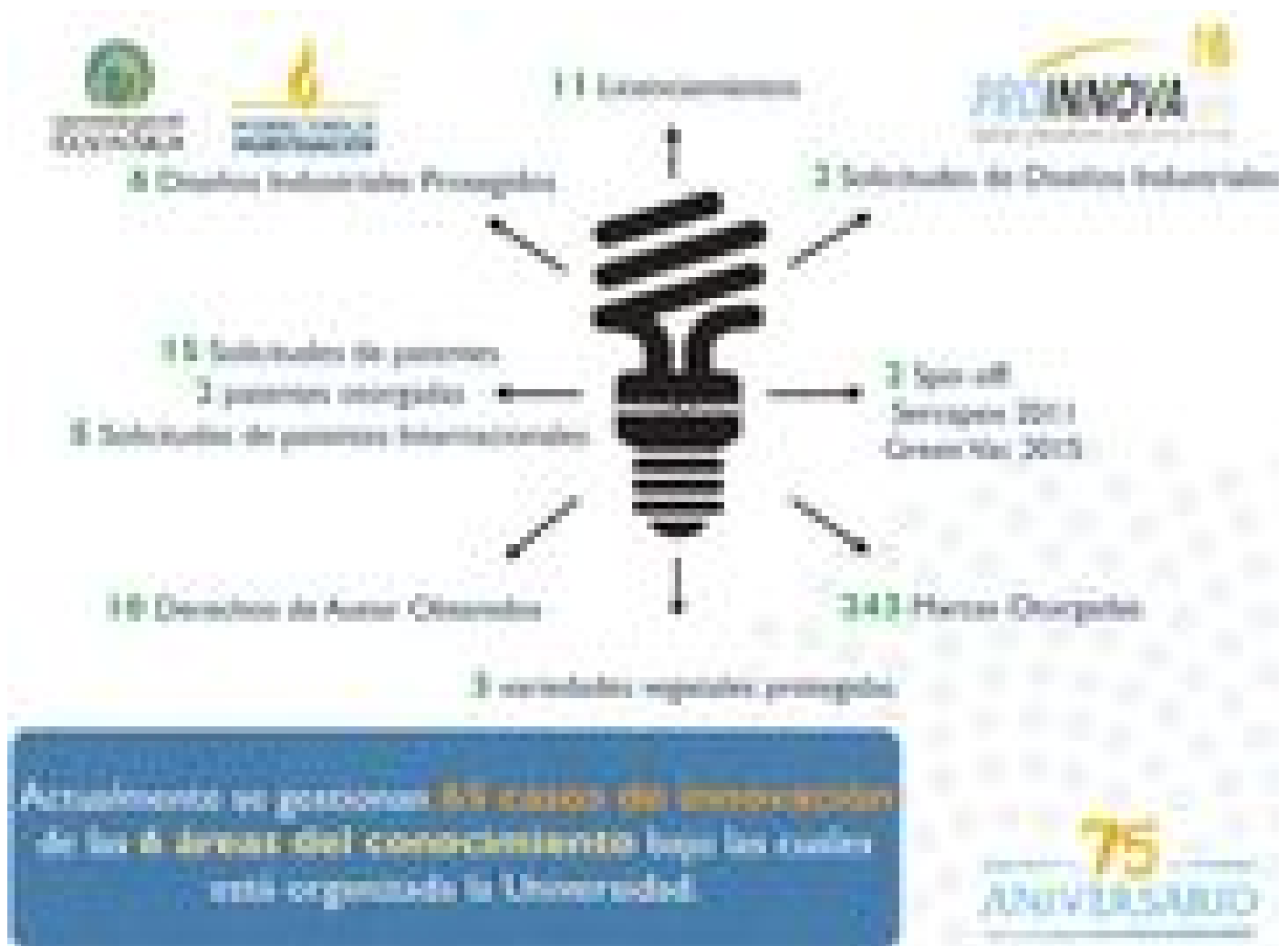
Detalle de los resultados obtenidos por Proinnova (Datos aportados por la vicerrectora de Investigación)

reciben más recursos económicos. También son las que lideran en las publicaciones en revistas indexadas y no indexadas, como capítulos de libro o libros.