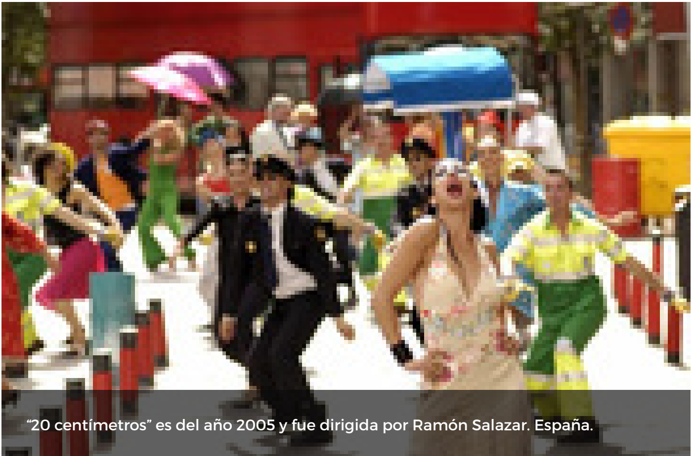
“20 centímetros” es del año 2005 y fue dirigida por Ramón Salazar. España.

A partir del viernes 5 de junio y durante todo el mes se proyectará un ciclo de cine dedicado a los derechos humanos, crímenes contra la humanidad y justicia global , con el propósito de generar una conciencia favorable sobre estos temas.