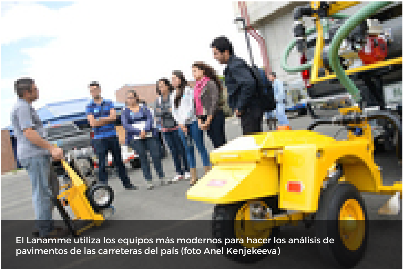
El Lanamme utiliza los equipos más modernos para hacer los análisis de pavimentos de las carreteras del país

El quinto informe anual que realiza el Laboratorio Nacional de Materiales y Modelos Estructurales de la Universidad de Costa Rica ( LanammeUCR ), a la Ruta 27 entre San José y Caldera, cuenta con importantes estudios a nivel estructural y funcional de la carretera, entre ellos los estudios realizados a las radiales, los puentes, taludes y la condición del pavimento.