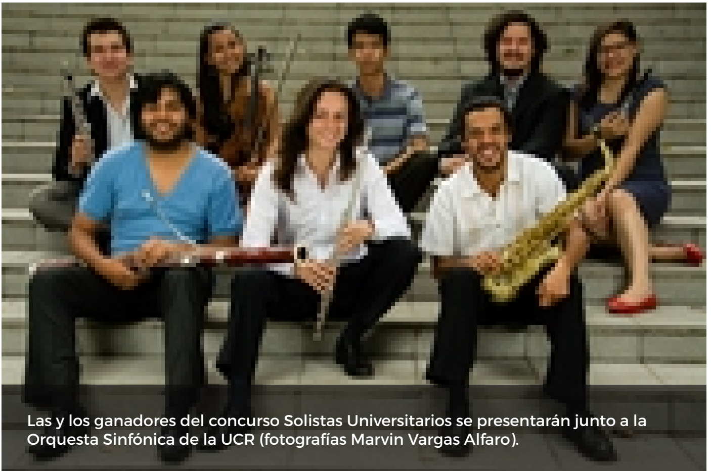
Las y los ganadores del concurso Solistas Universitarios se presentarán junto a la Orquesta Sinfónica de la UCR.

Ocho estudiantes ganadores de la segunda edición del concurso Solistas Universitarios , que organiza la Escuela de Artes Musicales, se presentarán junto a la Orquesta Sinfónica de la Universidad de Costa Rica , en dos conciertos de gala.