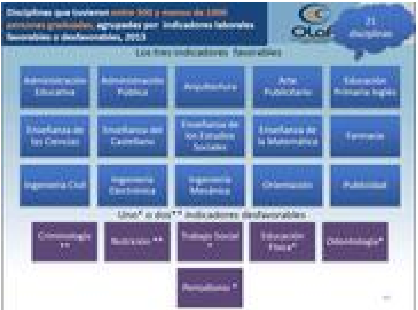
Situación laboral de carreras que poseen más de 1000 graduados (ilustración cortesía OLAP).

Por su parte, las áreas de las Ingenierías (3,49%) Ciencias Económicas (3,59%) Ciencias de la Salud (3,62%) y Ciencias Básicas (3,79%) fueron las que obtuvieron los porcentajes más bajos en materia de desempleo.