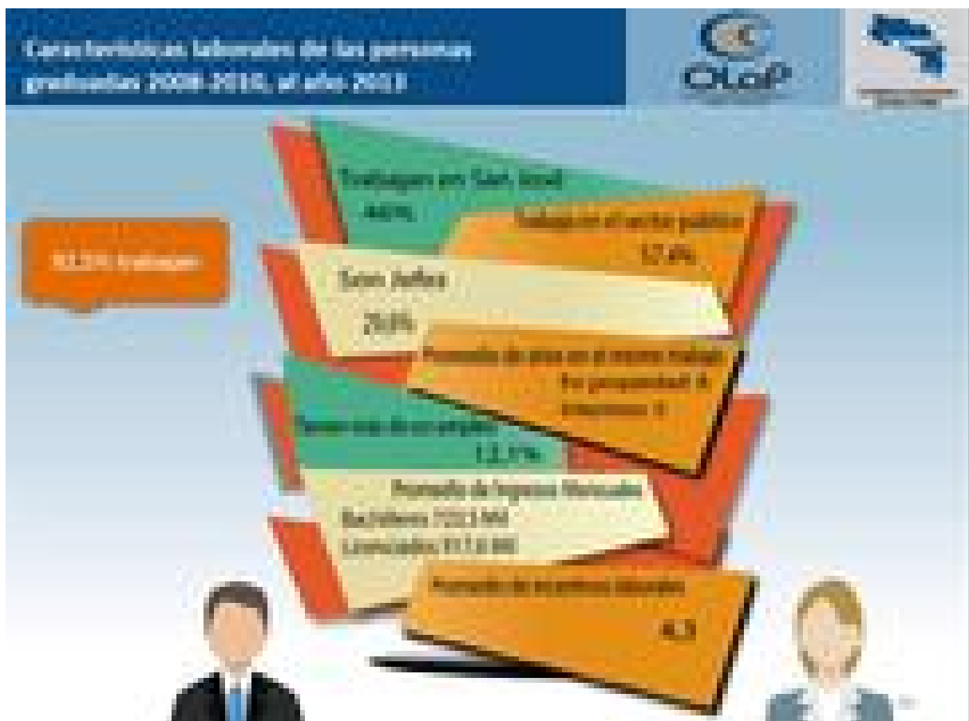
Características de los profesionales que tienen empleo (ilustración cortesía OLAP).

“Se puede notar que hay un margen entre lo que el país obtuvo en porcentajes de desempleo en relación con los porcentajes que obtuvieron cada una de las áreas del conocimiento en esa materia, con esto podemos apreciar que si bien es cierto la crisis nos afecta a todos, la gente que tiene más años de escolaridad tiene un nivel de afectación menor que los que tienen menos años de escolaridad” afirmó Gutiérrez.