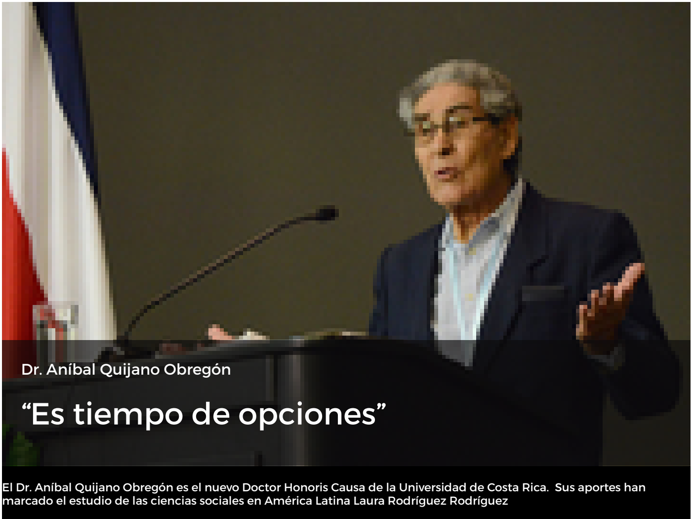
Dr. Aníbal Quijano Obregón