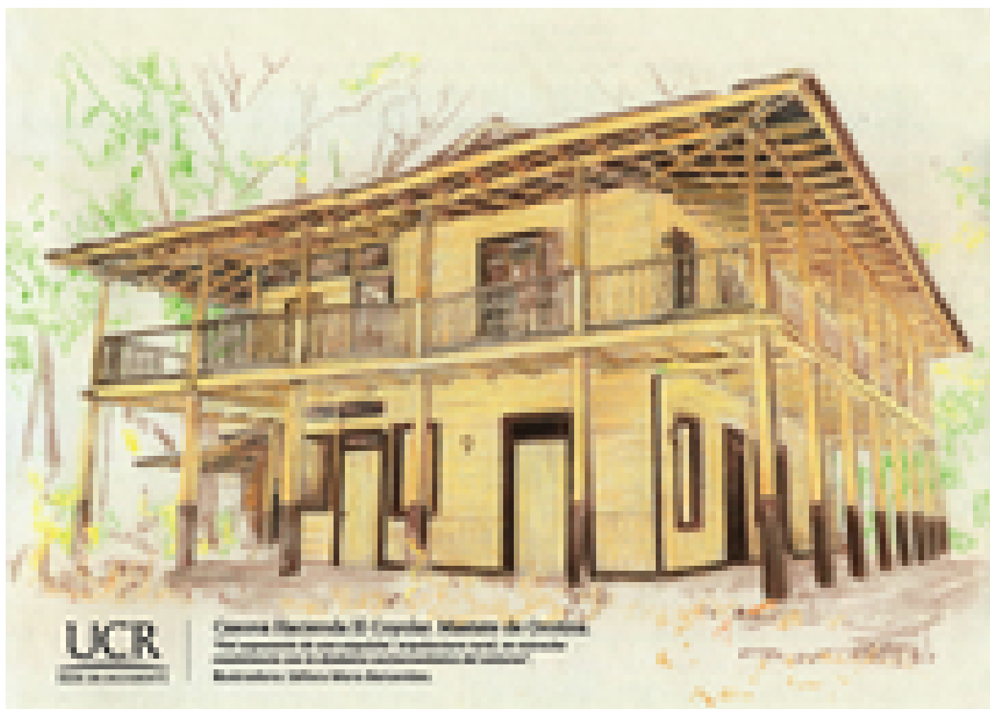
Ilustración de Hacienda El Coyolar en Orotina. Realizada por Séfora Mora Benavides.

De esta forma, la Coordinación de Acción Social por medio de esta publicación, valora el patrimonio presente en la región de Occidente. Según Piñeiro son “obras que han logrado perdurar estableciendo lazos muy fuertes que propician una mayor cercanía con los procesos históricos que llevaron al desarrollo social, económico y cultural, a la vez que forjaron las identidades culturales e idiosincrasia de los pobladores de esta región del país” .