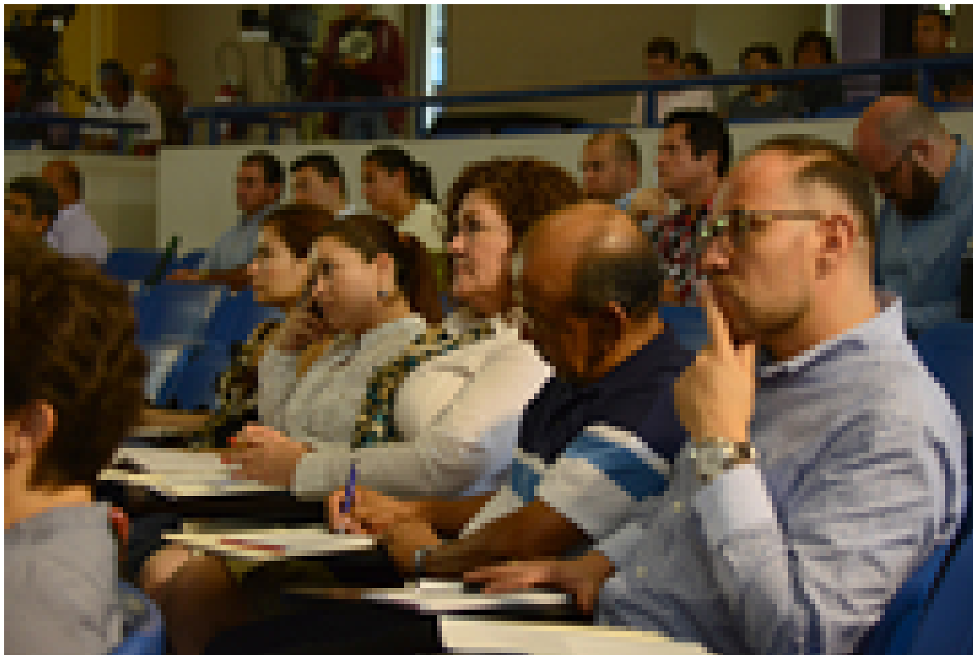
El II Foro Institucional 2015 se realiza en el auditorio de la Ciudad de la Investigación.

Pero, añadió Murillo, la UCR ha consolidado una capacidad muy importante de análisis con investigadores de alto nivel que tienen la responsabilidad de emitir opinión, orientación sobre temas de importancia para el país como un todo.