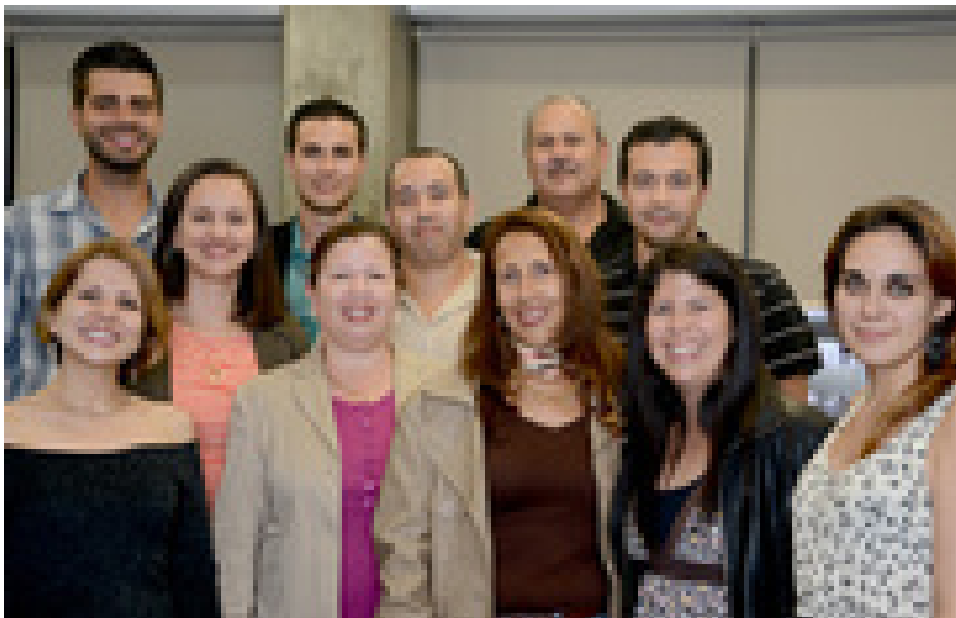
Los integrantes del Sistema de Gestión de Calidad del INISA participaron en la actividad (Foto: Anel Kenjekeera).

El ECA es una entidad pública de carácter no estatal creada en 1996 con el propósito de acreditar los laboratorios de ensayo y calibración, los laboratorios clínicos, los organismos de inspección, los organismos de certificación y los organismos verificadores de gases de efecto invernadero.