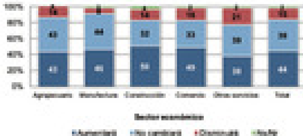
GRÁFICO 3 EXPECTATIVA DEL COMPORTAMIENTO EN LAS VENTAS O PRODUCCIÓN SEGÚN SECTOR ECONÓMICO, III TRIMESTRE 2014