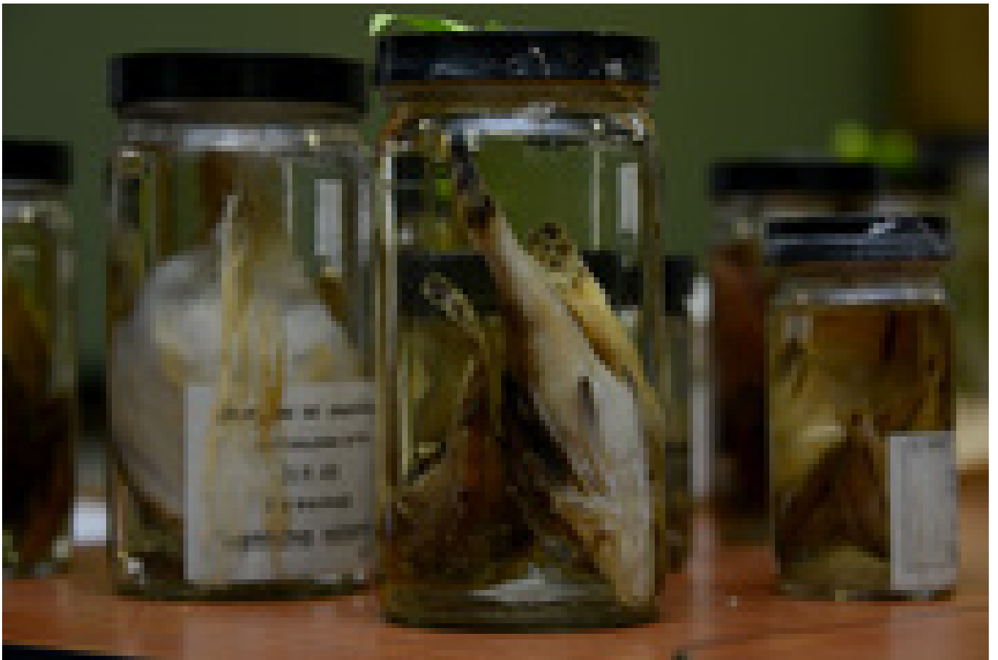
Muestra de peces en la Escuela de Biología.