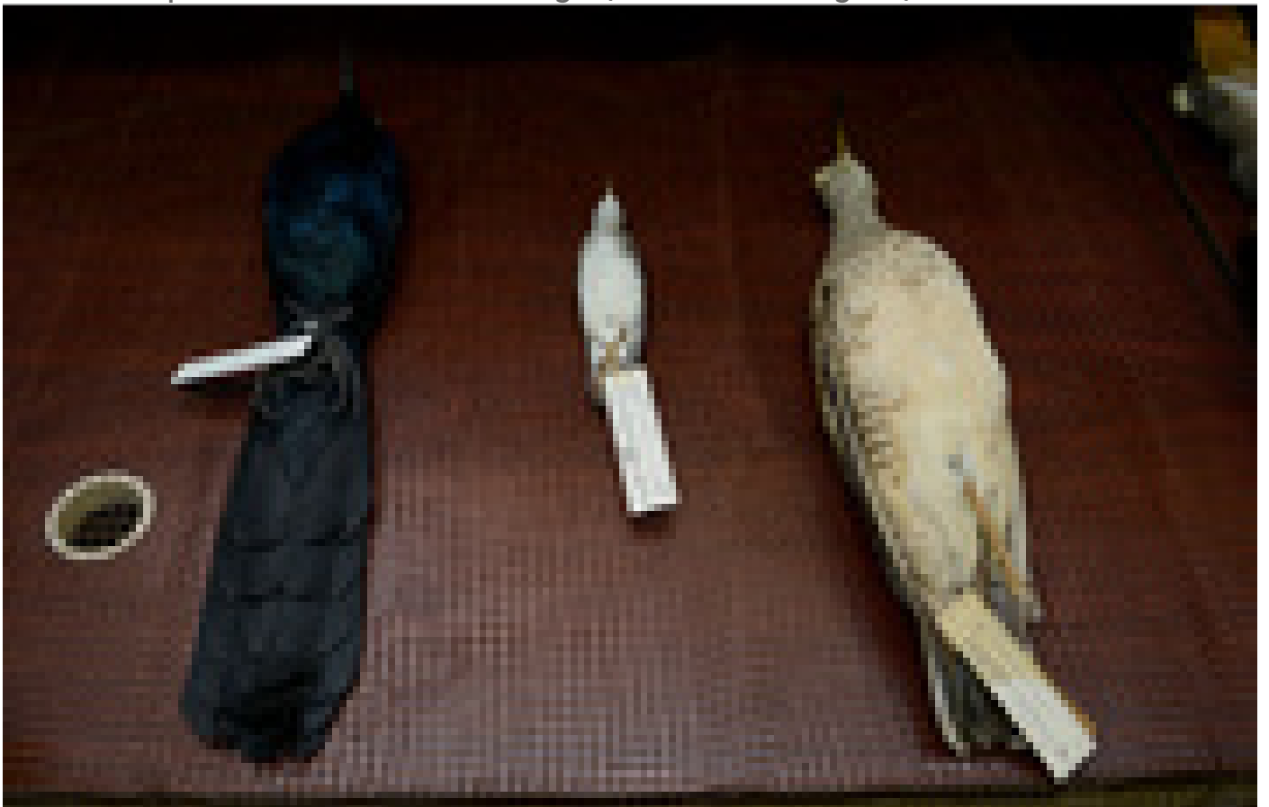
Pájaros en exhibición de animales en la Escuela de Biología.